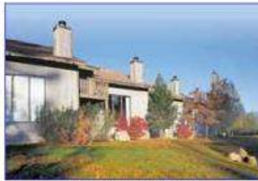
Lake Placid Club