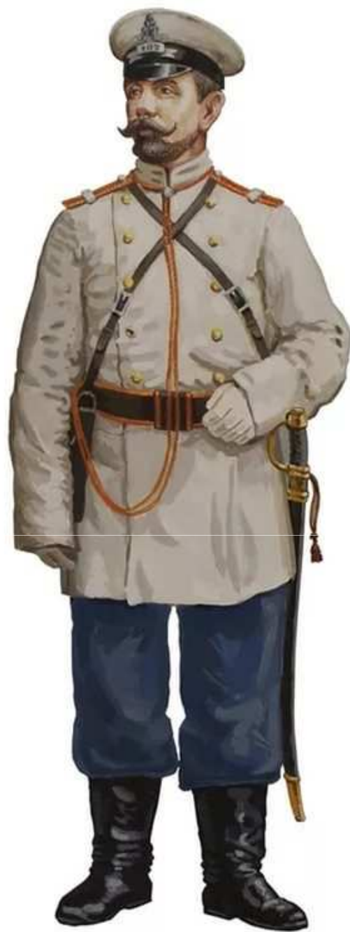
Губернский городовой, 1883 г.