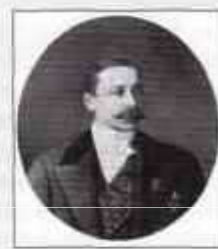
МАКОВ Лев Саввич (1830 г. — 28 февраля (12 марта) 1883 г.) Министр внутренних дел с ноября 1878 г. по август 1880 г.