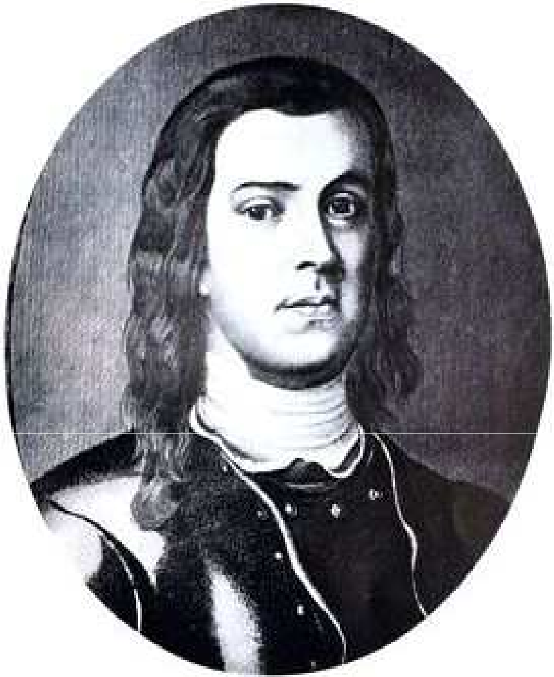
Генерал-адъютант, граф Антон Эммануилович Девиер. Первый Санкт- Петербургский генерал-полицмейстер с 1718 по 1727 гг.