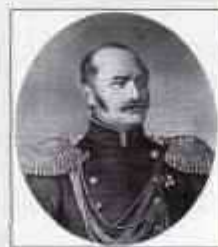
БИБИКОВ Дмитрий Гаврилович (18 (29) марта 1791 г. — 22 февраля (6 марта) 1870 г.) Министр внутренних дел с августа 1852 г. по август 1855 г.