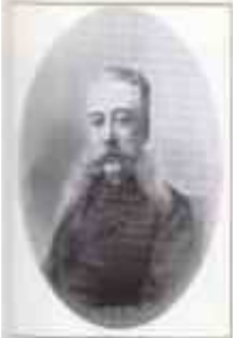
ГОРЕМЫКИН Иван Логгинович (27 октября (8 ноября) 1839 г. — 11 (24) декабря 1917 г.) Министр внутренних дел с октября 1895 г. по октябрь 1899 г.