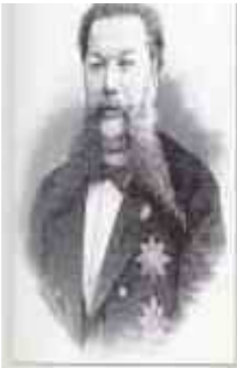
ДУРНОВО Иван Николаевич (4 (16) марта 1834 г. — 29 мая (11 июня) 1903 г.) Министр внутренних дел с апреля 1889 г. по октябрь 1895 г.