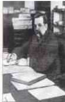
БУЛЫГИН Александр Григорьевич (1851 г. — 5 сентября 1919 г.) Министр внутренних дел с января по октябрь 1905 г.