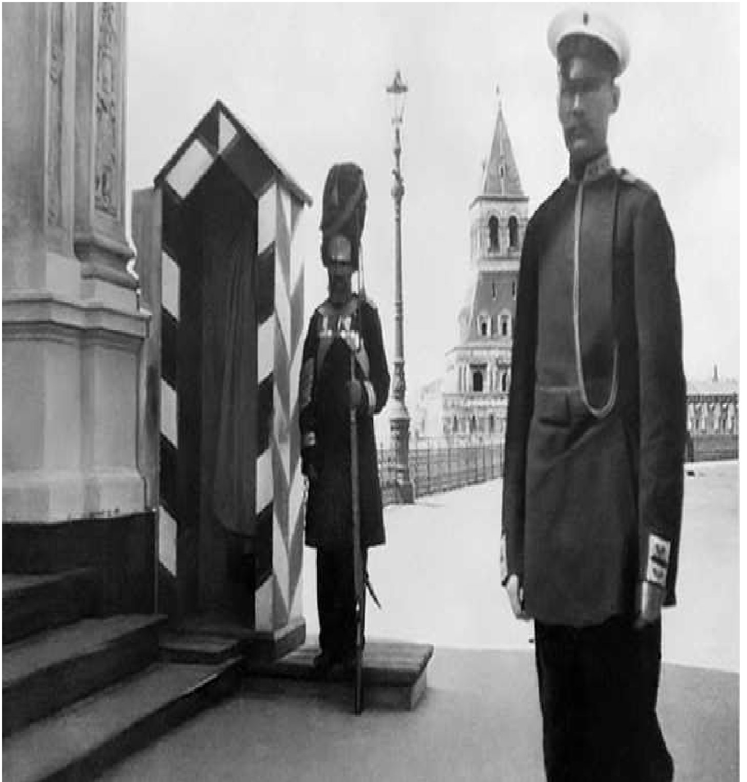
Полицейский и гвардеец на Красной площади.