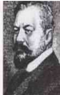
ЩЕРБАТОВ Николай Борисович (22 января (3 февраля) 1868 г. — 23 июня 1943 г.) Министр внутренних дел с июня по сентябрь 1915 г.