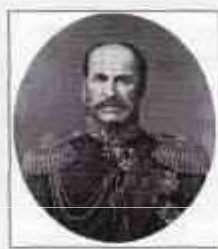
Граф СТРОГАНОВ Александр Григорьевич (31 декабря 1795 г. (11 января 1796 г.) — 2 (14) августа 1891 г.) Министр внутренних дел с марта 1839 г. по сентябрь 1841 г.