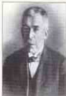
ДУРНОВО Пётр Николаевич (24 марта (5 апреля) или 23 ноября (5 декабря) 1842 г. — 11 (24) сентября 1915 г.) Министр внутренних дел с октября 1905 г. по апрель 1906 г.