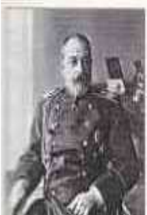
Князь СВЯТОПОЛК-МИРСКИЙ Пётр Данилович (18 (30) августа 1857 г. — 16 (29) 1914 г.) Министр внутренних дел с августа 1904 г. по январь 1905 г.