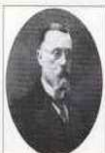
МАКАРОВ Александр Александрович (7 (19) июля 1857 г. — февраль 1919 г.) Министр внутренних дел с сентября 1911 г. по декабрь 1912 г.