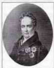
Князь КОЧУБЕЙ Виктор Павлович (11 (22) ноября 1768 г. — 3 (15) июня 1834 г.) Министр внутренних дел с сентября 1802 г., по ноябрь 1807 г. и с ноября 1819 г. по июнь 1823 г.