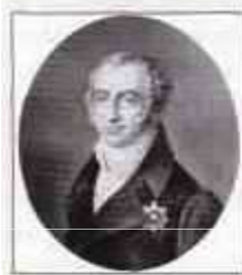
КОЗОДАВЛЕВ Осип Петрович (29 марта (9 апреля) 1754 г. — 24 июля (5 августа) 1819 г.) Министр внутренних дел с марта 1810 г. по июль 1819 г.