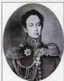
ЗАКРЕВСКИЙ Арсений Андреевич (13 (24) сентября 1783(1786) г. — 11 (24) января 1865 г.) Министр внутренних дел с апреля 1828 г. по ноябрь 1831 г.