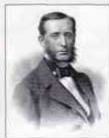
Граф ВАЛУЕВ Пётр Александрович (22 сентября (4 октября) 1815 г. — 27 января (8 февраля) 1890 г.) Министр внутренних дел с апреля 1861 г. по март 1868 г.