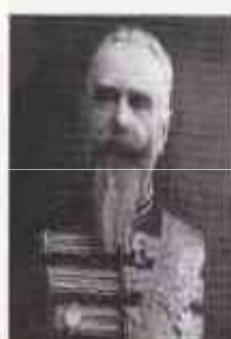
ШТЮРМЕР Борис Владимирович (15 июля 1848 г. — 20 августа 1917 г.) Министр внутренних дел с 3 марта по 7 июля 1916 г.