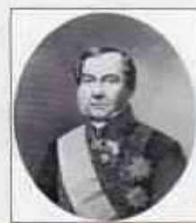
Граф ЛАНСКОЙ Сергей Степанович (23 декабря 1787 г. (3 января 1788 г.) — 26 января (7 февраля) 1862 г.) Министр внутренних дел с августа 1855 г. по апрель 1861 г.