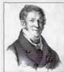
Барон КАМПЕНГАУЗЕН Балтазар Балтазарович (5 (16) января 1772 г. — 11 (23) сентября 1823 г.) Министр внутренних дел с июня по август 1823 г.