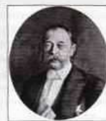
Граф ТОЛСТОЙ Дмитрий Андреевич (1 (13) марта 1823 г. — 25 апреля (7 мая) 1889 г.) Министр внутренних дел с мая 1882 г. по апрель 1889 г.