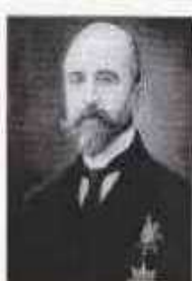
ХВОСТОВ Александр Алексеевич (8 января 1857 г. — 25 ноября 1922 г.) Министр внутренних дел с 7 июля по 16 сентября 1916 г.