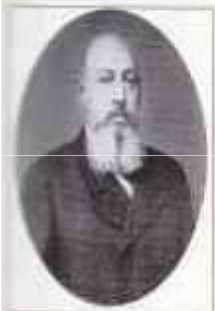
СИПЯГИН Дмитрий Сергеевич (8 (20) сентября [5(17) марта] 1853 г. — 2 (15) апреля 1902 г.) Министр внутренних дел с октября 1899 г. по апрель 1902 г.