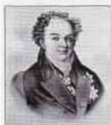
Князь КУРАКИН Алексей Борисович (19 (30) сентября 1759 г. — 30 декабря 1829 г. (11 января 1830 г.) Министр внутренних дел с ноября 1807 г. по март 1810 г.