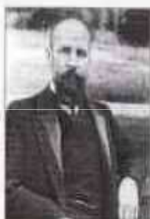
СТОЛЫПИН Пётр Аркадьевич (5 (17) апреля 1862 г. — 5 (18) сентября 1911 г.) Министр внутренних дел с апреля 1906 г. по сентябрь 1911 г.