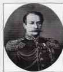
ТИМАШЕВ Александр Егорович (3 (15) апреля 1804 г. — 20 января (1 февраля) 1893 г.) Министр внутренних дел с марта 1868 г. по ноябрь 1878 г.