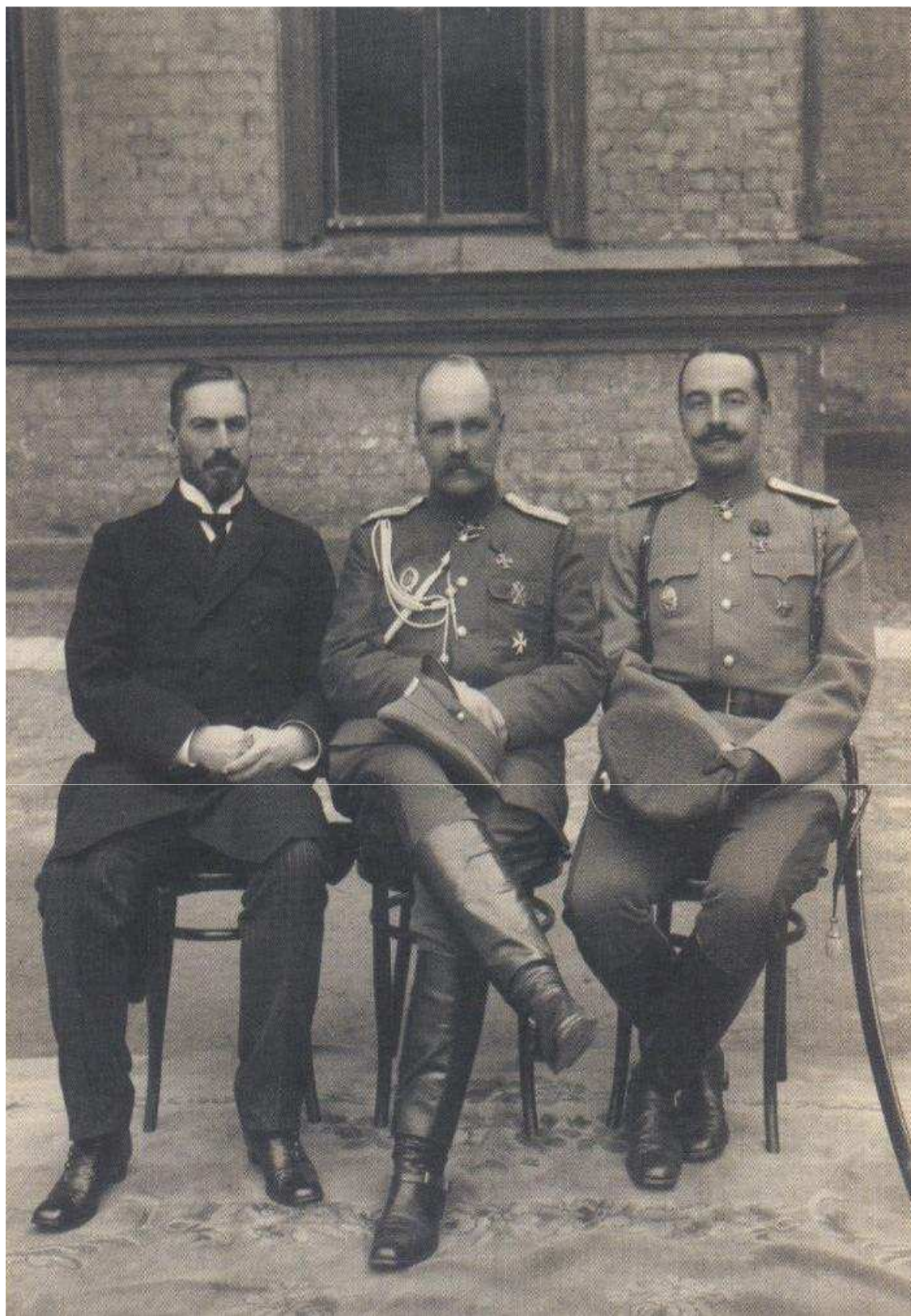
Товарищ министра внутренних дел и командир Отдельного корпуса жандармов В. Ф. Джунковский и его команда: новый директор Департамента полиции В. А. Брюн де Сент-Ипполит и начальник штаба Корпуса жандармов В. П. Никольский.