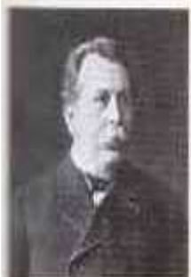
ПЛЕВЕ Вячеслав Константинович (8 (20) апреля 1846 г. — 15 (28) июля 1904 г.) Министр внутренних дел с апреля 1902 г. по июль 1904 г.