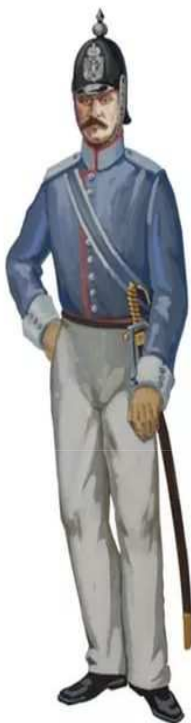
Городовой, 1853 г.