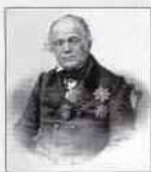
Граф БЛУДОВ Дмитрий Николаевич (5 (16) апреля 1785 г. — 9 (21) февраля 1864 г.) Министр внутренних дел с февраля 1832 г. по февраль 1839 г.