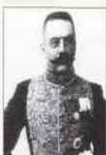
МАКЛАКОВ Николай Александрович (9 (21) или 7 (19) сентября 1871 г. — 5 или 7 сентября 1918 г.) Министр внутренних дел с декабря 1912 г. по июнь 1915 г.