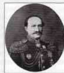
Граф ИГНАТЬЕВ Николай Павлович (17 (29) января 1832 г. — 20 июня (3 июля) 1908 г.) Министр внутренних дел с мая 1881 г. по май 1882 г.