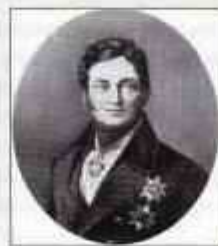
Граф ПЕРОВСКИЙ Лев Алексеевич (9 (16) сентября 1792 г. — 9 (17) ноября 1856 г.) Министр внутренних дел с сентября 1841 г. по август 1852 г.