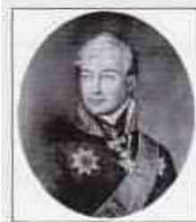
ЛАНСКОЙ Василий Сергеевич (1754 г. — 22 июня (4 июля) 1831 г.) Министр внутренних дел с августа 1823 г. по апрель 1828 г.