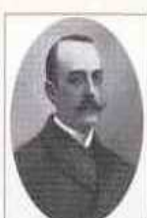
ПРОТОПОПОВ Александр Дмитриевич (18 декабря 1866 г. — 27 октября 1918 г.) Министр внутренних дел с 16 сентября 1915 г. по 28 февраля 1917 г.