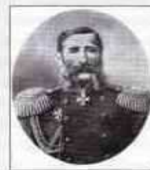
Граф ЛОРИС-МЕЛИКОВ Михаил Тариелович (19 (31) октября 1824 г. или 21 октября (2 ноября) 1925 г. — 12 (24) декабря 1888 г.) Министр внутренних дел с августа 1880 г. по май 1881 г.