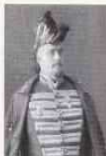
ХВОСТОВ Алексей Николаевич (1 (13) июня или июля 1872 г. — 5 сентября 1918 г.) Министр внутренних дел с сентября 1915 г. по март 1916 г.