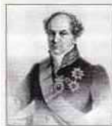
Князь ГОЛИЦИН Александр Николаевич (8 (19) декабря 1773 г. — 22 ноября (4 декабря) 1884 г.) Министр внутренних дел с августа по ноябрь 1819 г.