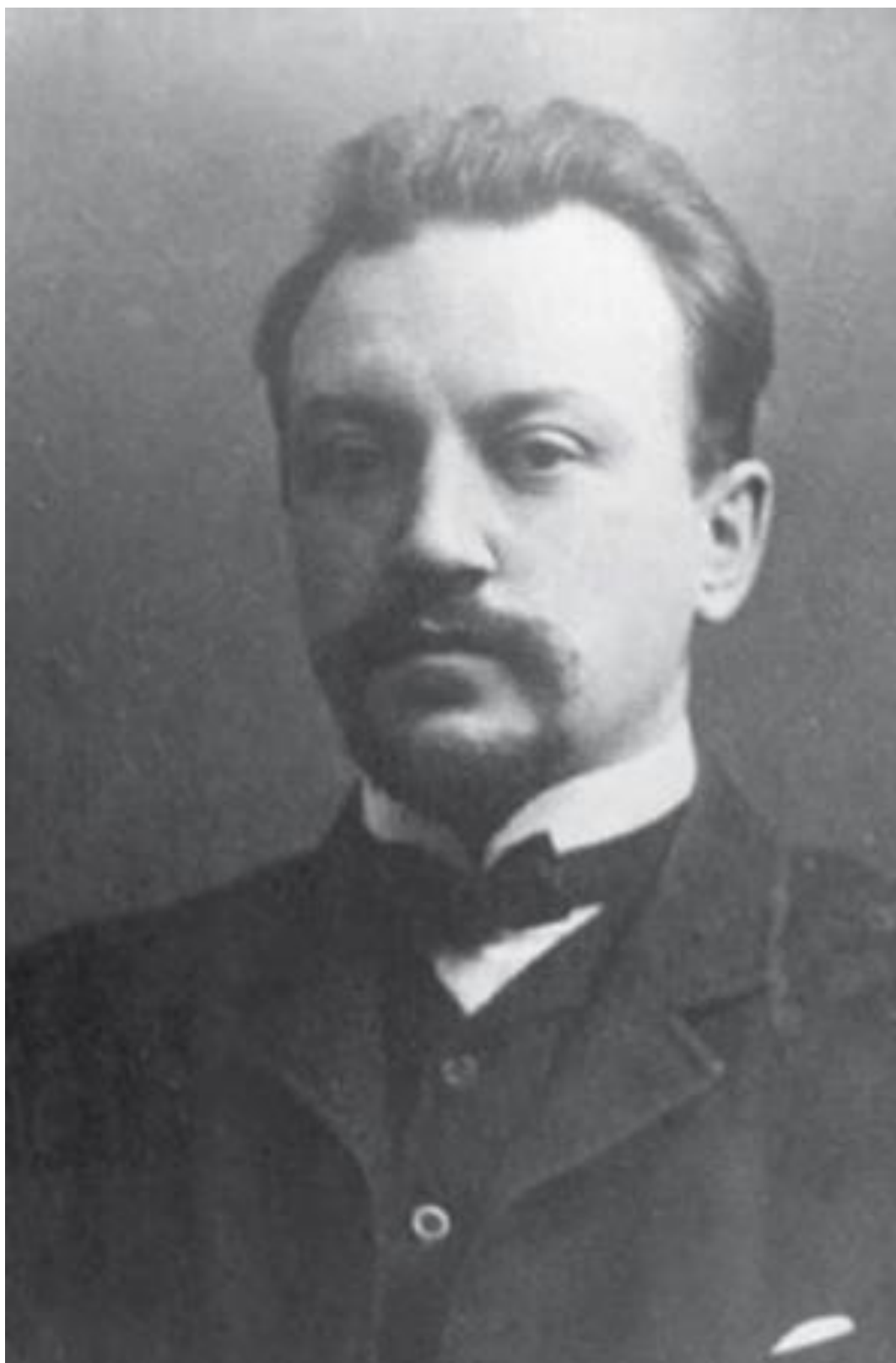
Д. Н. Ушаков