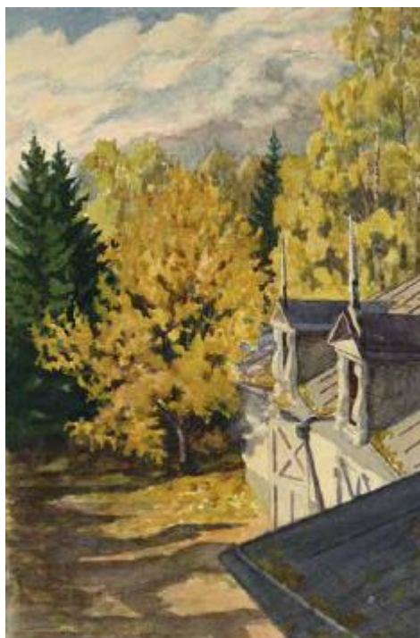
Санаторий «Узкое». 1923-1927 гг.