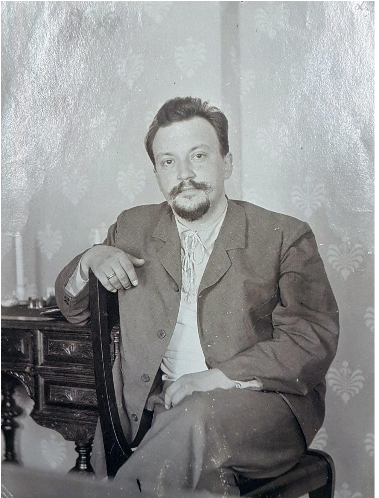
Д. Н. Ушаков