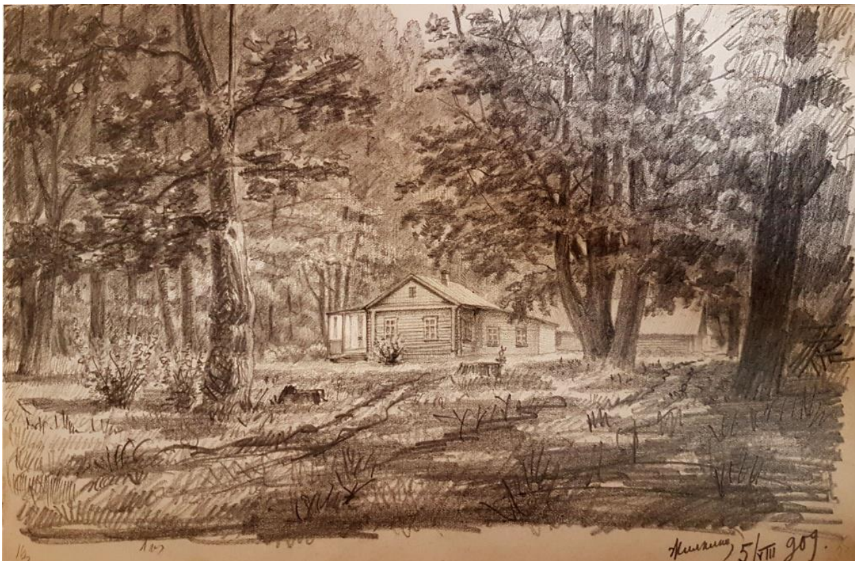
Д. Н. Ушаков. Жилкино. Вид на лесное озеро. 1909 г.