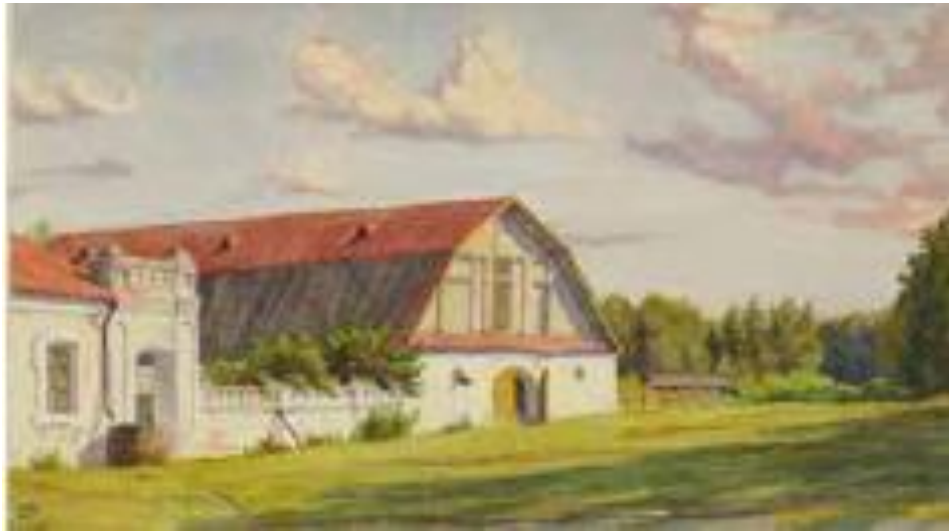
Д. Н. Ушаков. Прохорово. 1914-1918 гг.