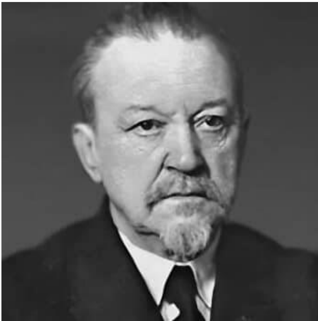
Дмитрий Николаевич Ушаков (1873-1942)