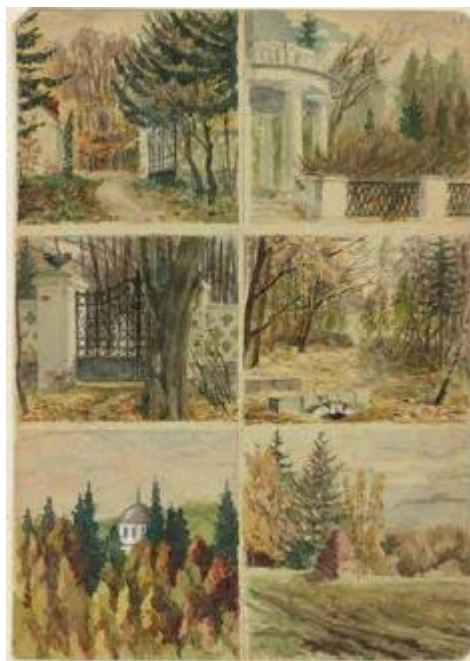
Д. Н. Ушаков. Подмосковье. Никольское. 1920 г.