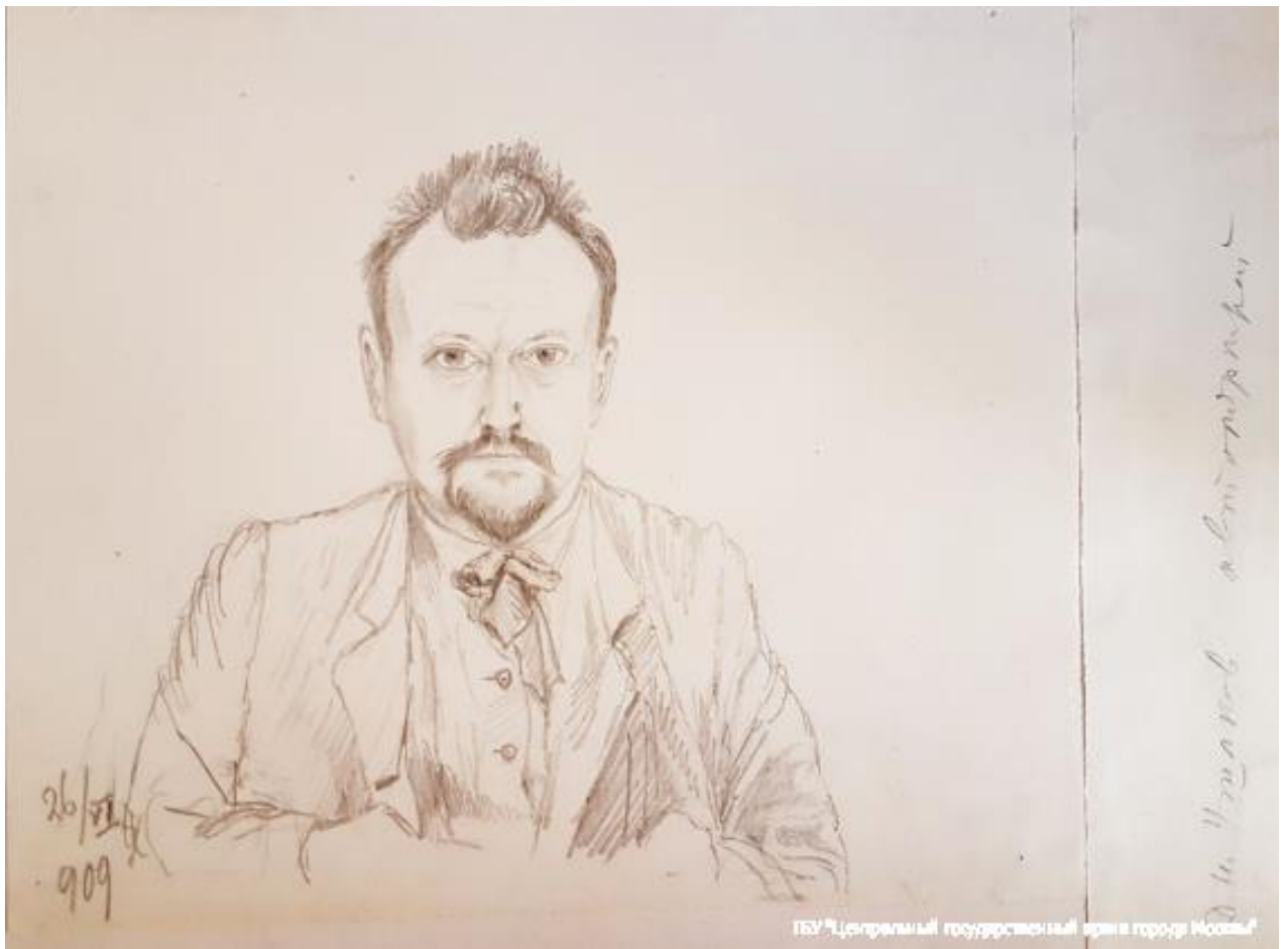
Д. Н. Ушаков. Автопортрет. 1900-е гг.