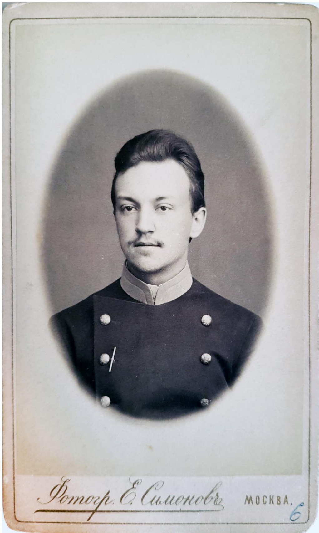
Д. Н. Ушаков в молодости