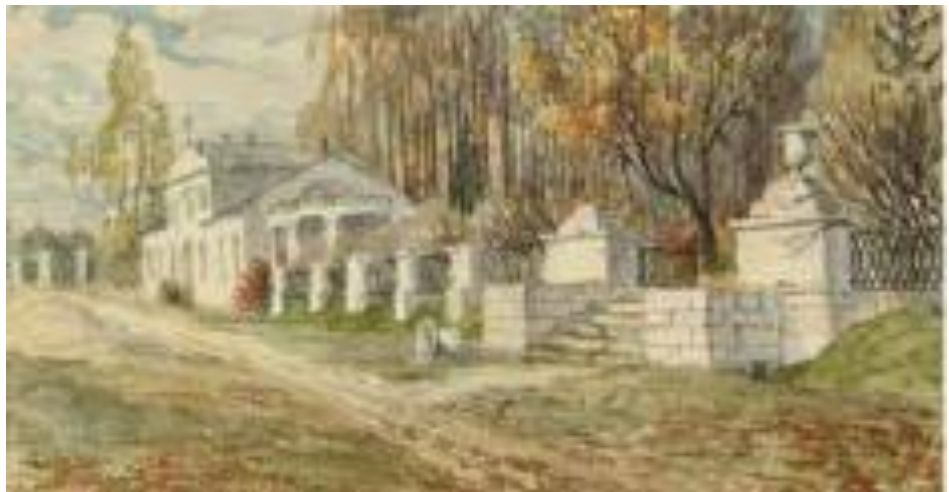
Д. Н. Ушаков. Подмосковье. Никольское. 1920 г.