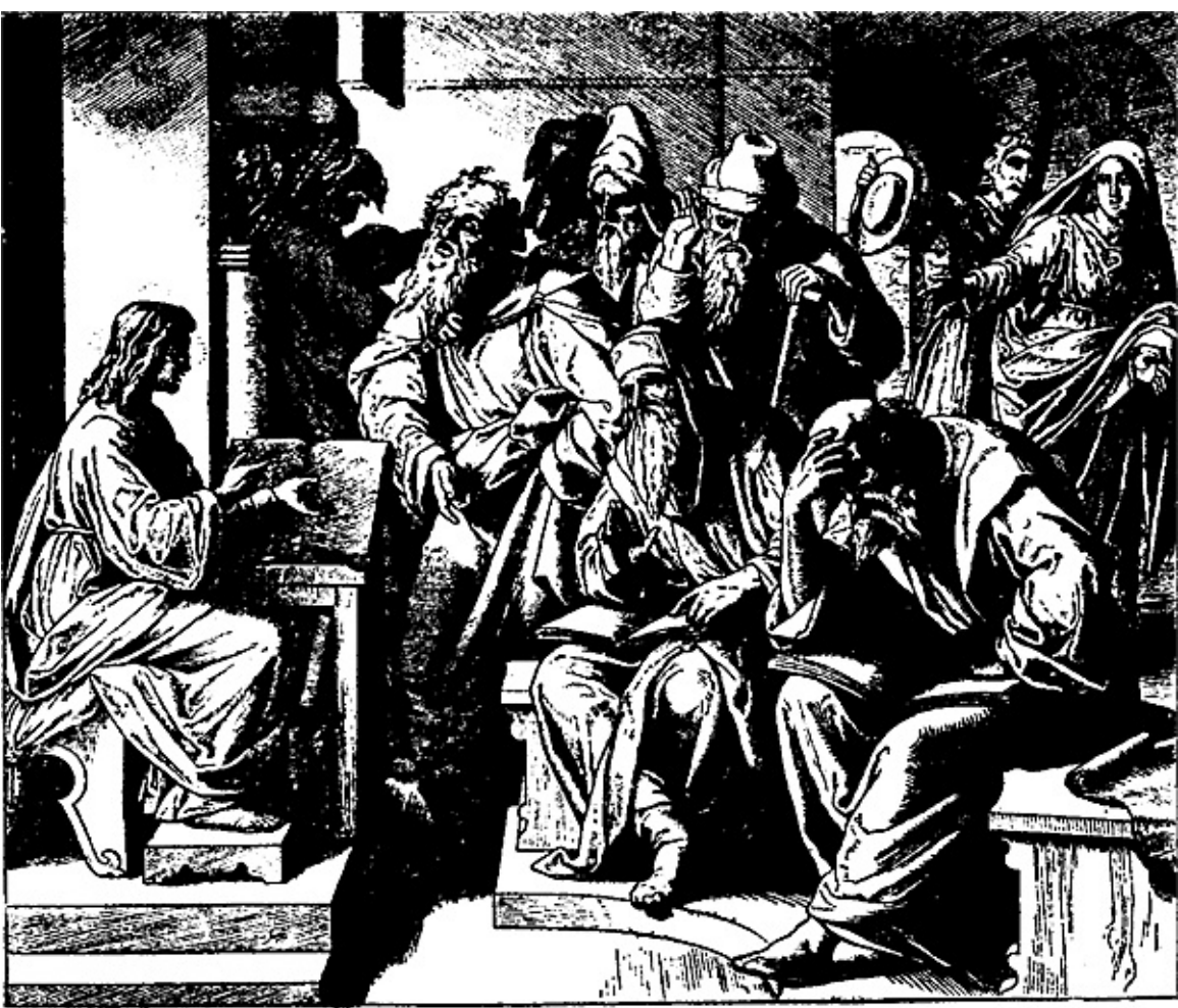
Иисус сидит в храме последи учителей