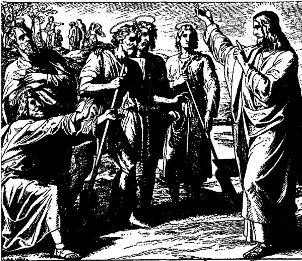
Иисус выбирает Себе учеников

Из числа слушателей Он выбрал Себе двенадцать учеников, которые повсюду сопровождали Его и назывались апостолами.