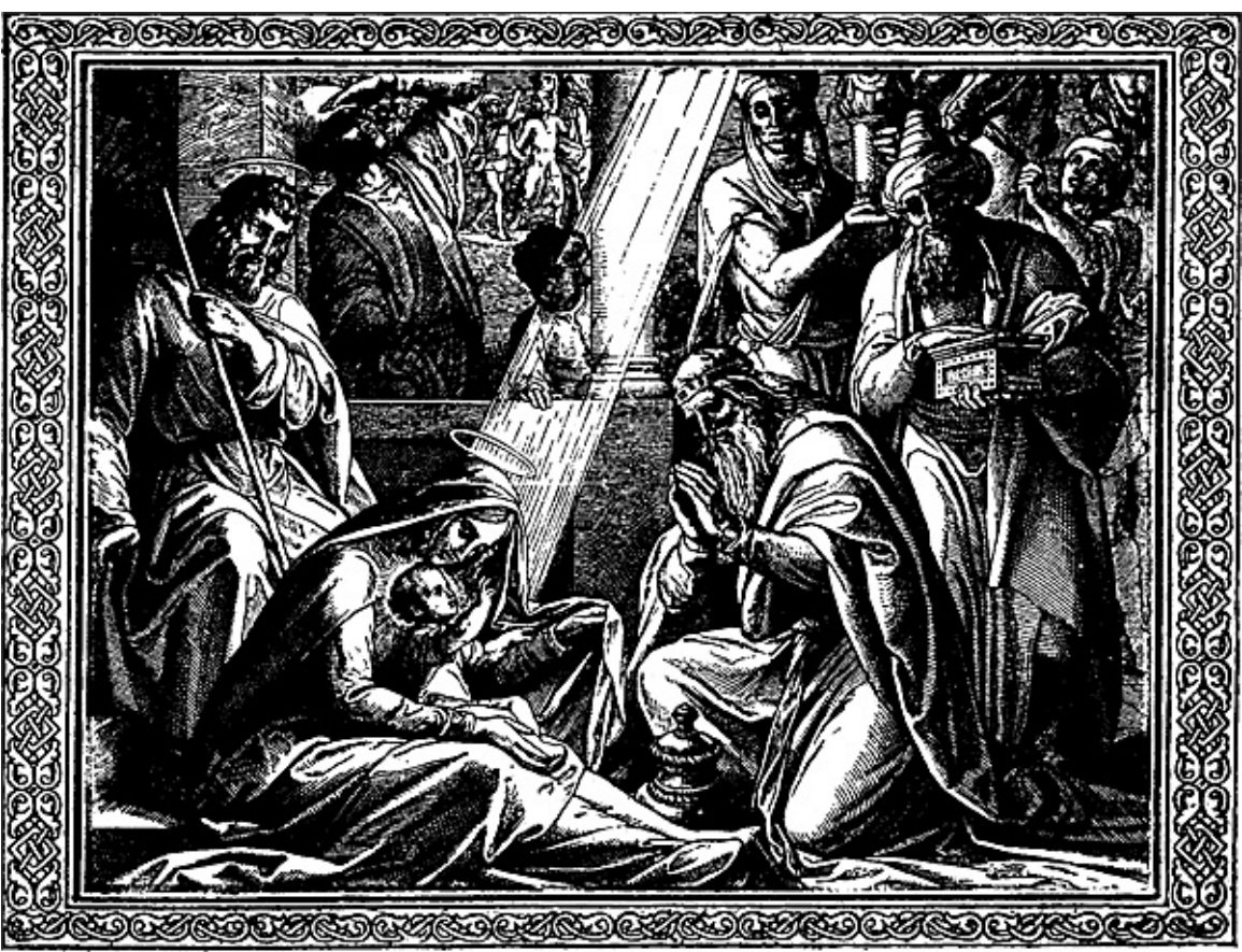
Ученые поклоняются младенцу