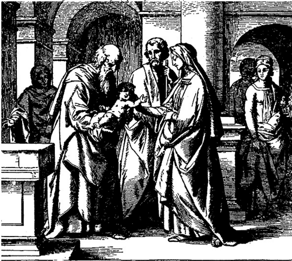
Симеон узнает Сына Божьего Иисуса

Иосиф немедленно собрался в путь и с Младенцем и Святою Матерью Его удалился в Египет. Царь Ирод начал искать Иисуса по всему царству, но нигде не мог найти.