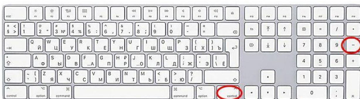
Способ ввода тире

8.2. Способ ввода тире: Ctrl + минус на цифровой клавиатуре.