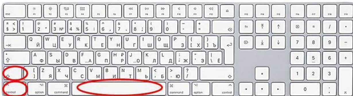
Способ ввода неразрывного пробела

6.1. Чтобы контролировать употребление неразрывного пробела, необходимо осуществлять набор и вычитку текста в режиме, когда показаны все непечатаемые символы, который включается при нажатии клавиши ¶ на панели инструментов.