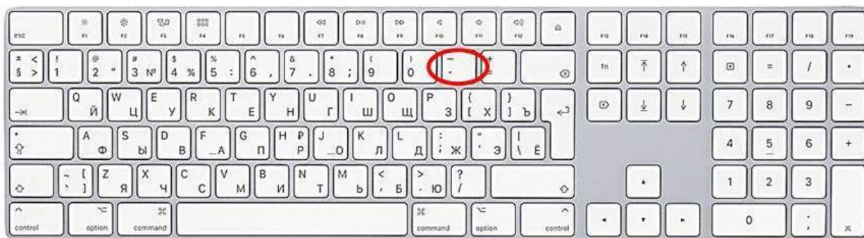
Способ ввода дефиса

7.2. Клавиша для ввода знака «дефис» расположена в верхнем цифровом блоке, делящая клавишу со знаком нижнего подчеркивания (нижний дефис).