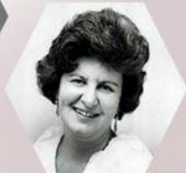
Н. П. Бехтерева