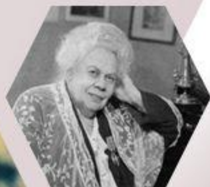
Е. Ф. Гнесина