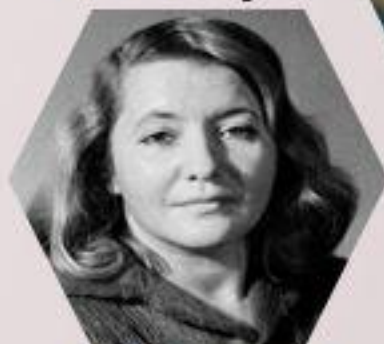
Ю. В. Друнина