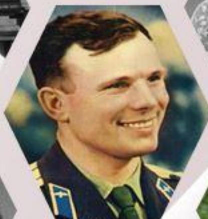
Ю. А. Гагарин