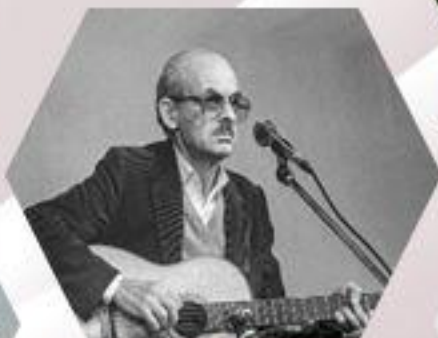
Б. Ш. Окуджав