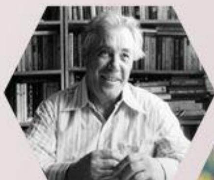
В. П. Астафьев