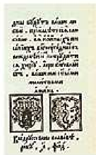
Иван Федоров. Азбука. Львов, 1574 г.

Воодушевленный успехом, Федоров в 1574 году издал первую русскую «Азбуку». Открывали ее 45 букв кириллического алфавита, расположенные сначала в прямом, а затем в обратном порядке. Азбуку дополняли различные примеры и грамматические конструкции, учебные тексты, а также молитвы, послания, притчи. Это была полноценная учебная книга, которая шла нарасхват и зачитывалась буквально до дыр. Единственный сохранившийся экземпляр «Азбуки» находится сегодня в библиотеке Гарвардского университета в США.