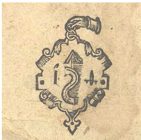
Печатный знак Ивана Федорова с Острожской Библии (1581 г.)

«Один книжник, англичанин, посмотрев Острожскую библию, воскликнул в восторге, что за лист этой книги он отдал бы Англию. Восторг современников понятен – никогда еще славянские книги не печатались с таким мастерством. Только шрифтов было использовано шесть, в том числе два греческих, - дело неслыханное и невиданное» (11, с. 26).