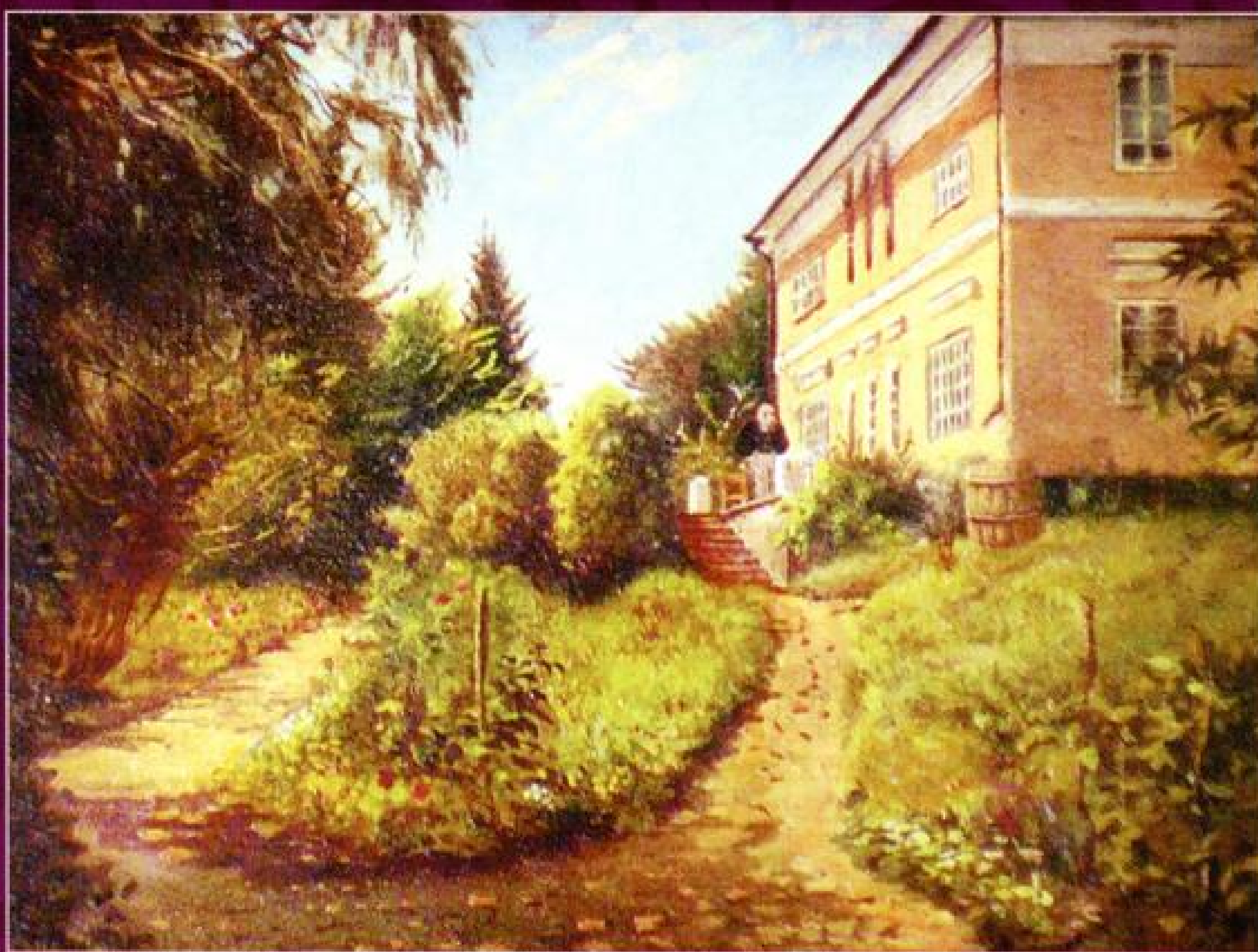
Имение Воробьевка. С акварели Я. Полонского.