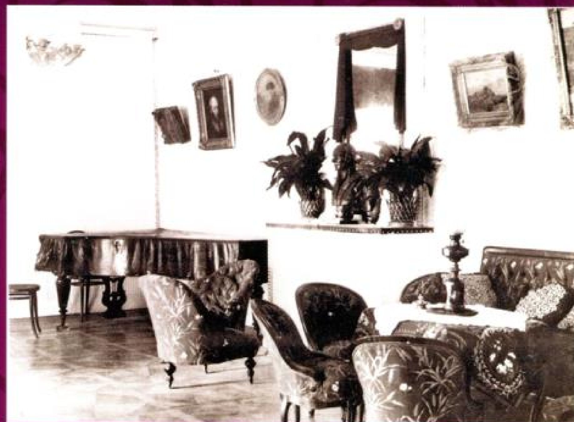
Гостиная в Воробьёвке.