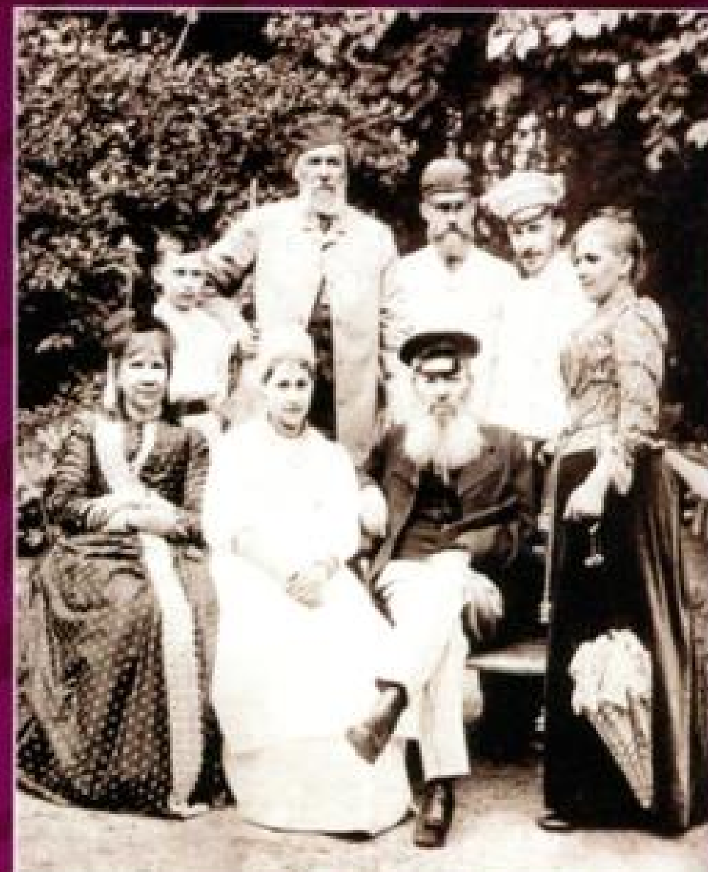
Семья друга юности Я. Полонского в гостях у Фета. 1890 г.

Философ, публицист, литературный критик Н. Страхов.