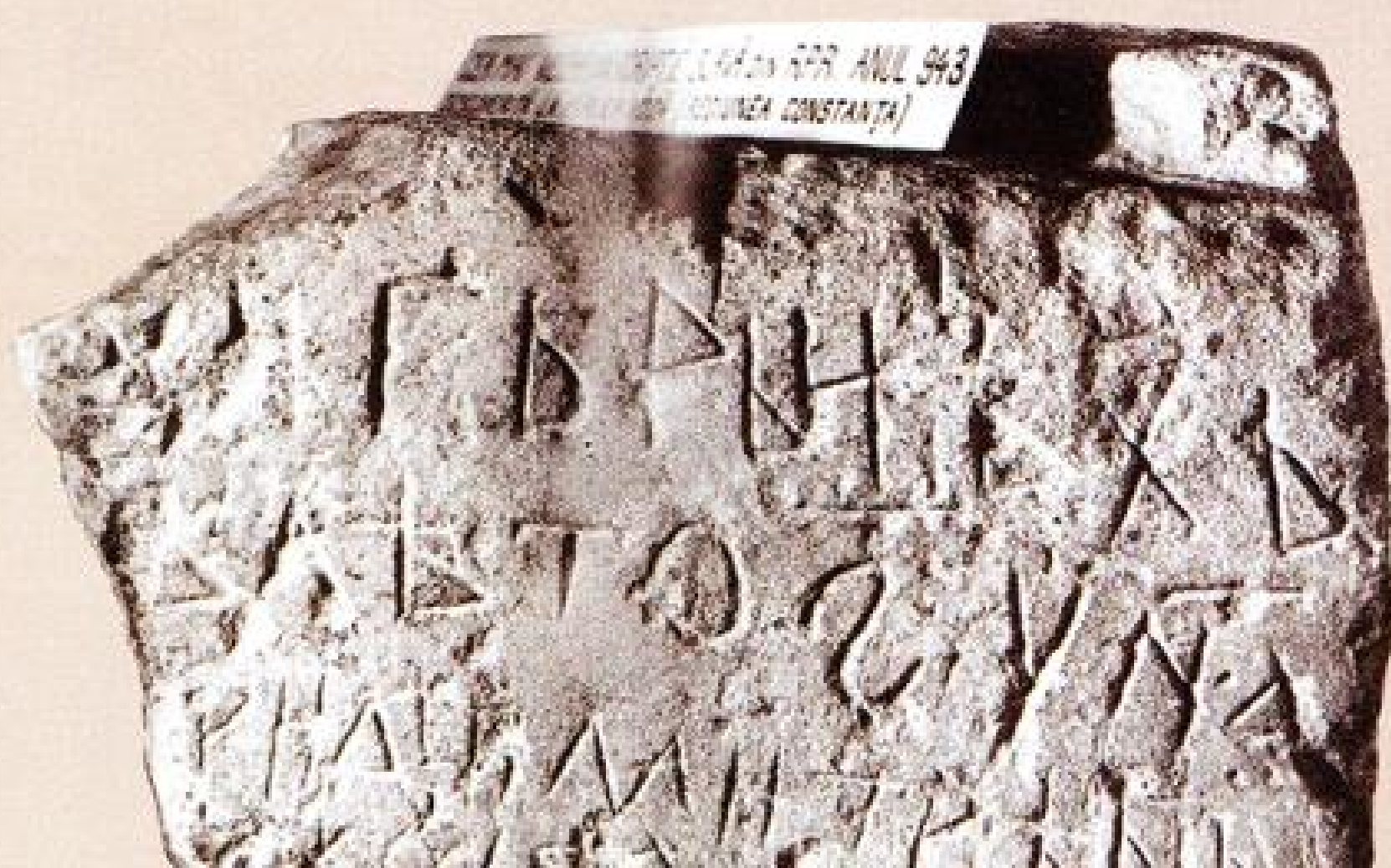
Славянская надпись 943 г. на камне, найденном в Мирчеа Вади поблизости от Констанцы в Румынии. Румынский национальный музей. Гаухарин.

Славянские языки принадлежат к индоевропейской языковой семье, куда входят также германские, балтские, италийские, кельтские, греческий, армянский, индоиранские, албанский, а также распространенные в древности фракийские, иллирийские, венетский, анатолийские и тохарские языки. Славянские, как и другие языки Средней Европы, оформились в самостоятельные сравнительно поздно. Ещё во II тысячелетии до н. э. в центре Европы существовала этноязыковая общность, которую образовывали племена индоевропейцев. Немецкий лингвист Г. Краэ предложил именовать эту общность древнеевропейской. Из неё позднее вышли кельты, италики, иллирийцы, германцы, балты и славяне. Древние европейцы выработали общую терминологию в области сельского хозяйства, религии и общественных отношений. Следы их пребывания на континенте являются названия рек и озер, распространённые на огромной территории — от юга Скандинавии на севере до Италии на юге