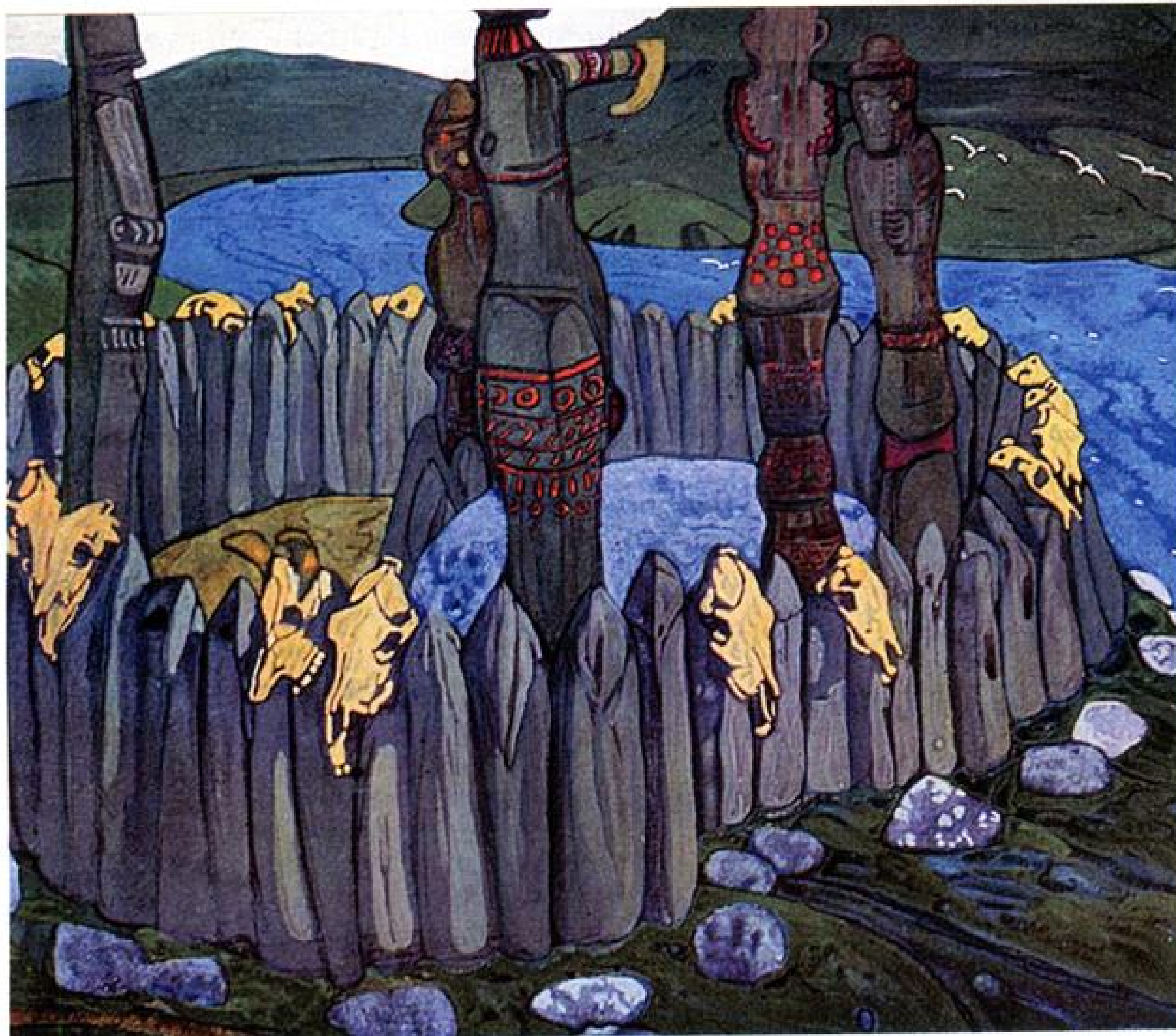
Идолы. Картина из серии «Начало Руси. Славяне». Худ. Н.К. Рерих. 1901

О семье Владимира красочно рассказывает «Повесть временных лет» еще в «языческой части» его истории. Согласно летописи, князь был побежден похотью и имел много жен и огромное число наложниц. Причем упоминаемые жены Владимира происходили из разных народов. Так, от варяжки Рогнеды у князя было четыре сына, в том числе Изяслав, Ярослав и Всеволод, и две дочери. Гречанка, которая прежде была женой Ярополка, родила Святополка (Окаянного). Вышеслав был сыном чешки, Святослав и Мстислав — тоже чешки, но другой, а Борис и Глеб роди-