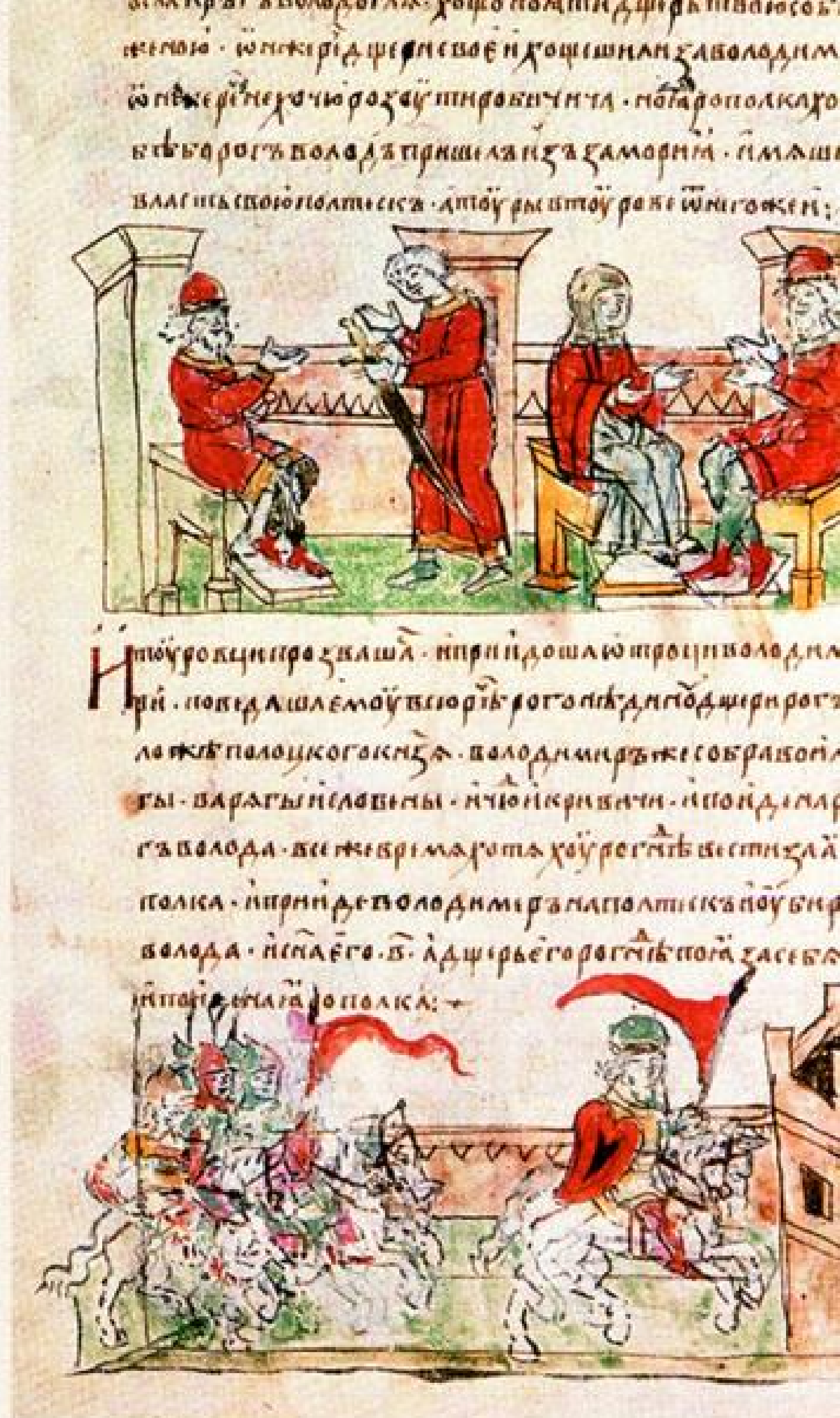
Захват Полоцка Владимиром. Миниатюра Радзивилловской летописи

Мы не будем вторгаться в чисто богословские вопросы, связанные с религиозным пере рождением Владимира. Отметим лишь, что в период бескомпромиссной борьбы за власть он получил первые политические уроки, приобрёл недюжинный государственный опыт, прошёл тяжкий путь от беглеца и изгоя до властелина огромной страны.