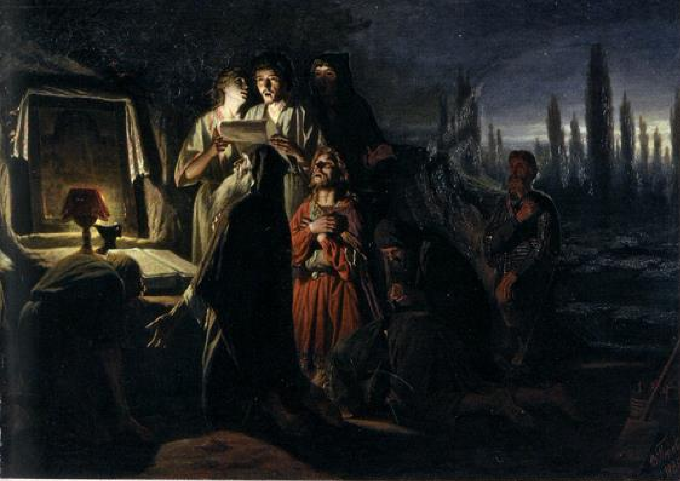
Первые христиане в Киеве. В. Г. Перов. 1880 г.

кретных обстоятельств. Автор «Повести временных лет» чётко говорит, что поход был предпринят «в ладьях», где располагались русские пещцы, и «берегомь», «на конихъ» — именно таким образом двигались против болгар дружественные кочевники. Вспомним, что в этом же направлении в 907 году «на конехъ и на кораблехъ» двинулось на Византию войско князя Олега. В 941 и в 943 годах рать Великого князя Игоря шла на Константинополь тем же путём и тем же способом: в 941 году — «придоша, и приплуша», в 943 году — «въ лодьяхъ и на конехъ», причём с русским войском снова шли кочевники — нанятые печенеги [5, с. 16, 22, 39].