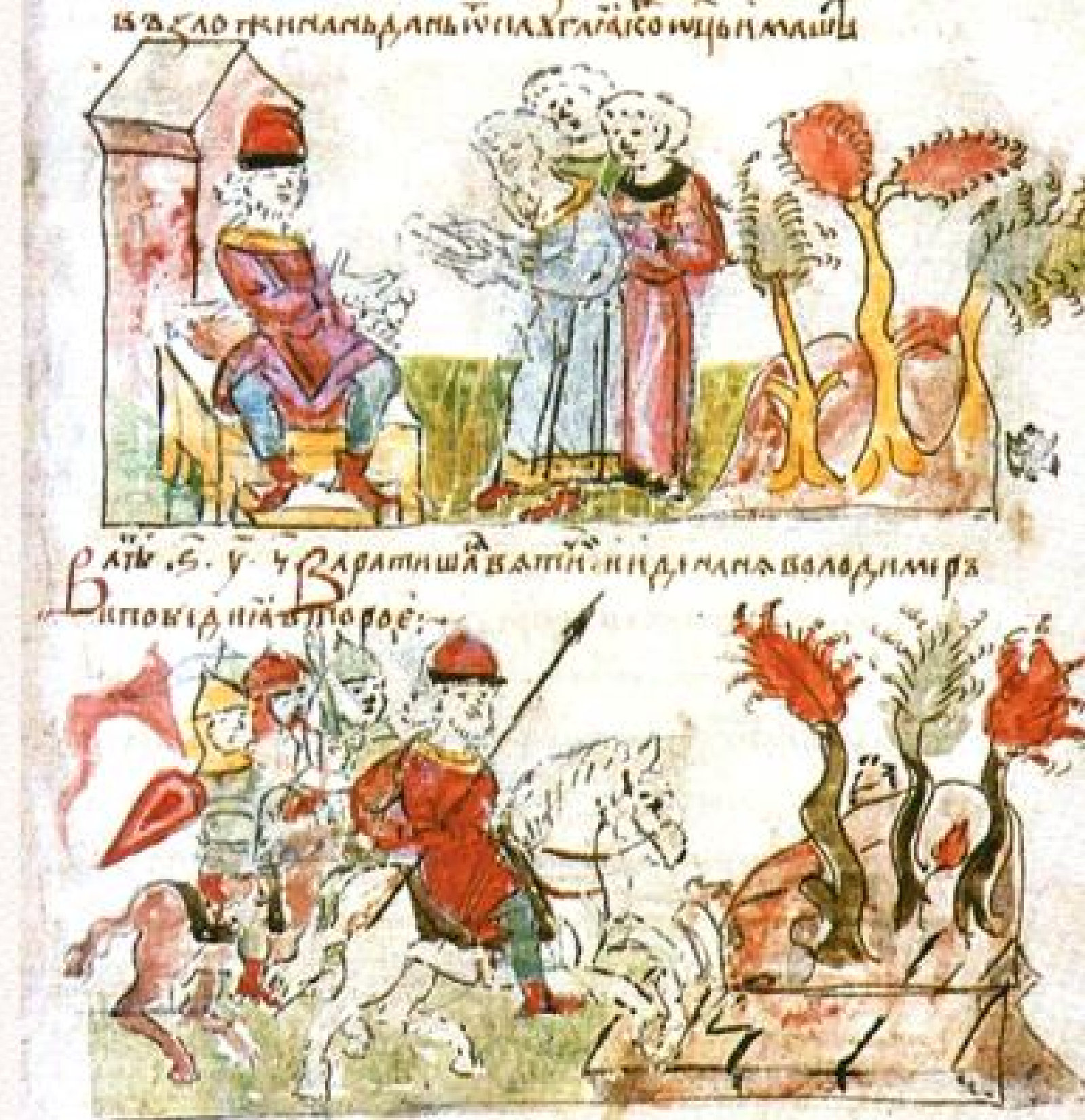
Походы Владимира на поляков, вятичей и ятвягов. Миниатюра Радзивилловской летописи

Почему мы говорим об этом так подробно? Потому что именно события 985 года на подступах к Балканам во многом определили дальнейшую глобальную политику Владимира.