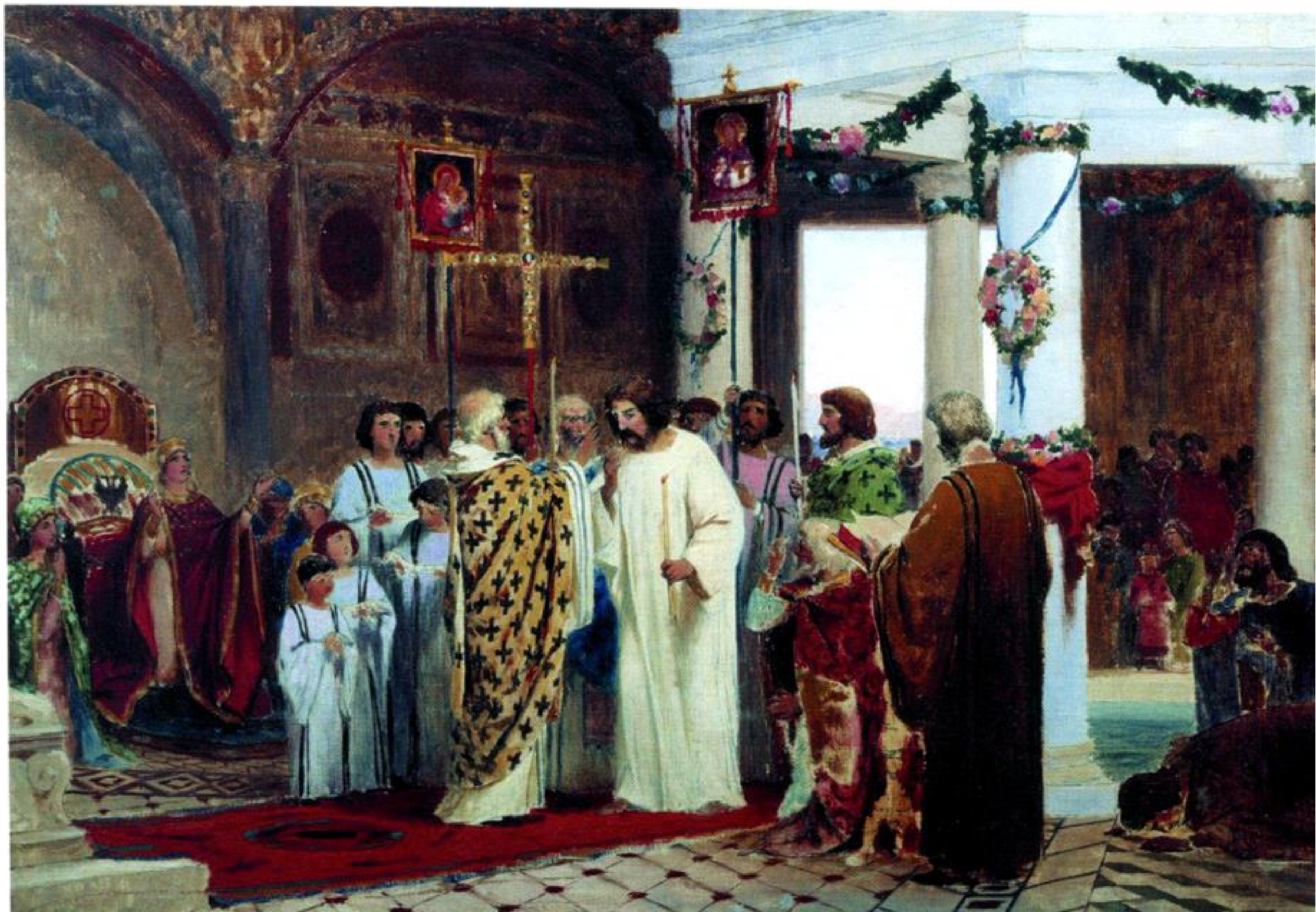
Крещение князя Владимира. Ф. А. Бронников

логом. Сначала «испугавшись конкуренции с великими мастерами прошлого», как признавал сам Виктор Михайлович, он всё же согласился. Работе