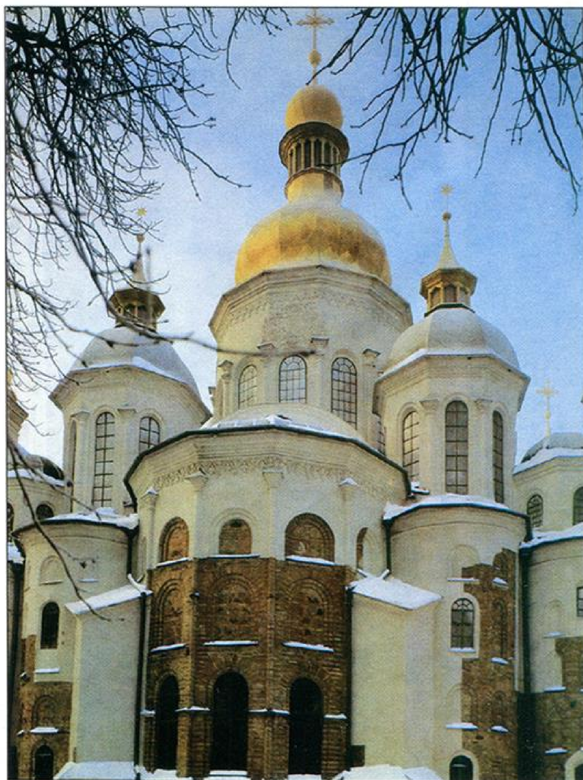
Один из ракурсов современной Святой Софии.