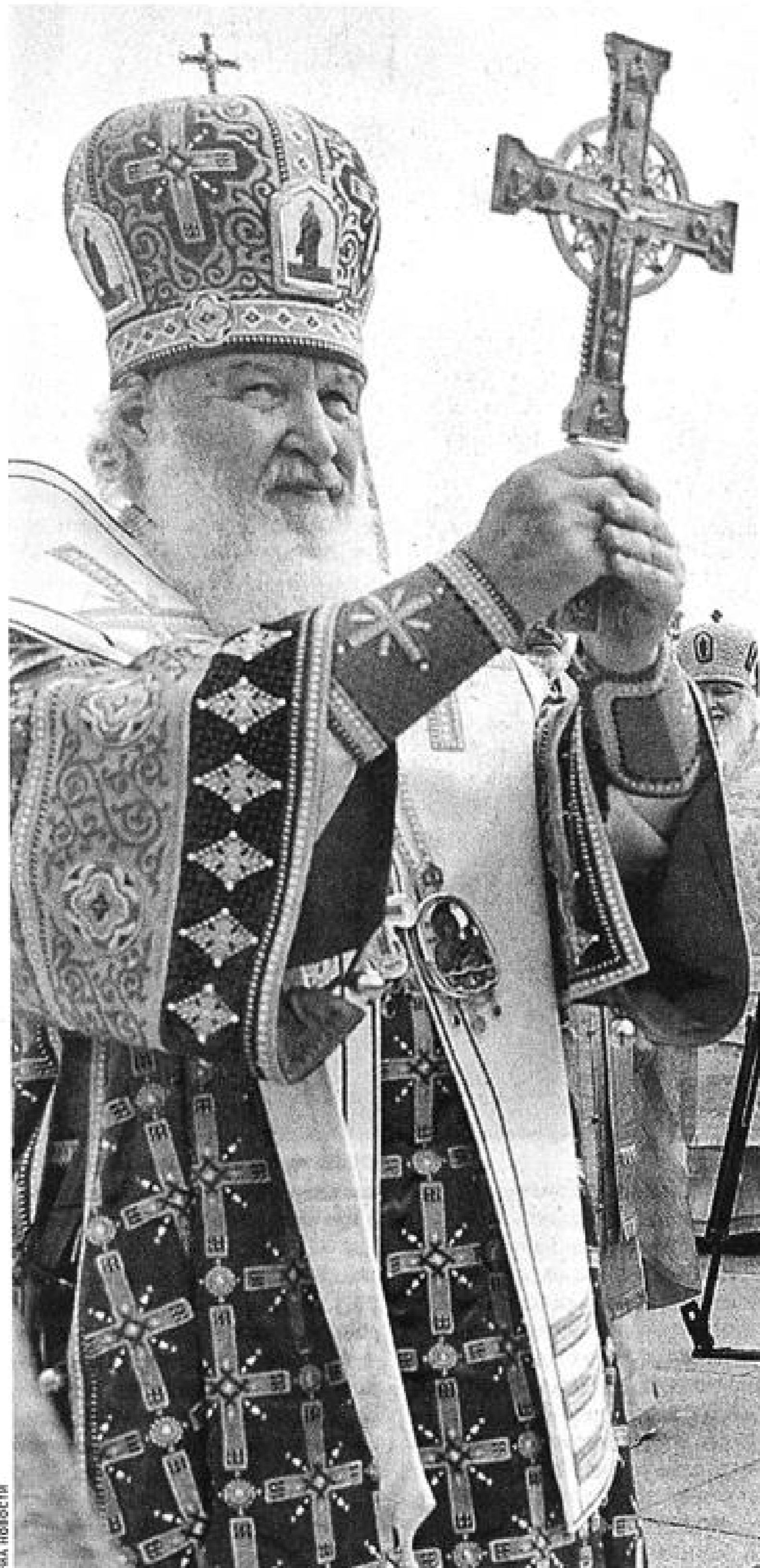
Патриарх Кирилл: Выбор князя Владимира подтверждается и нашим сегодняшним выбором.

«Крещение — это отправная точка становления и развития российской государственности, настоящего духовного рождения наших предков, определения их идентичности, самосознания, расцвета национальной культуры и образования, развития многоплановых связей с другими странами», — продолжил Путин. «Пра-