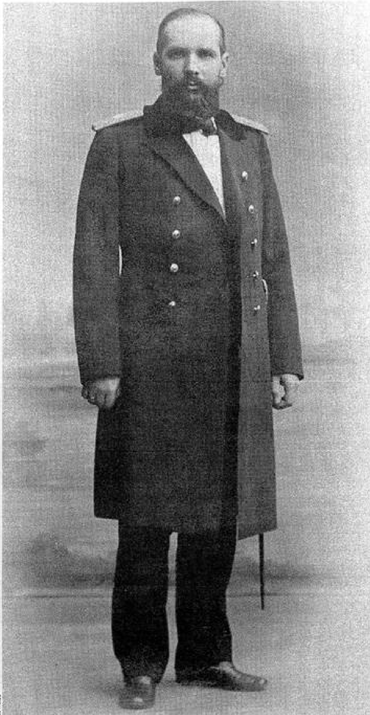
Петр Столыпин: «Мы предлагаем скромный, но верный путь».

12 августа 1906 г. по старому стилю государь издал указ о передаче Крестьянскому банку сельскохозяйственных земель, находящихся в собственности Романовых; 27 августа — о продаже казенных земель; 19 сентября — о продаже крестьянам земель на