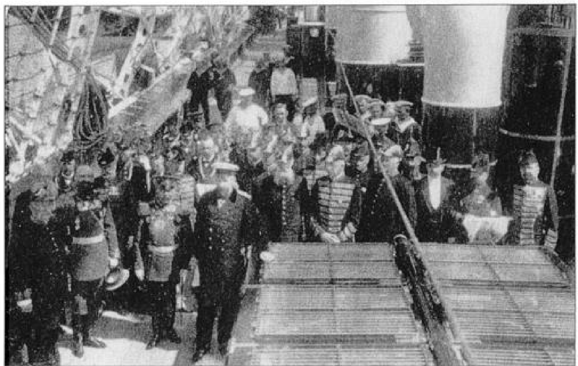
П. А. Столыпин и ревельское дворянство на яхте «Штандарт» в ожидании прибытия государя императора для свидания с королём Эдуардом VII. 27 мая 1908 г.

ключевое значение имел Указ 5 октября 1906 года «Об отмене некоторых ограничений в правах сельских обывателей и лиц других бывших податных сословий» 8 , который непосредственно касался миллионов крестьян. Указ, с одной стороны, ликвидировал архаичную систему разного рода ограничительных мер, свидетельствовавших о вопиющей гражданской и политической неполноправности, а также об ущемлении личного достоинства крестьян, а с другой — предоставлял крестьянам широкий круг прав, уравнивающих их в положении с другими категориями населения, в том числе и с дворянством (в отношении государ-