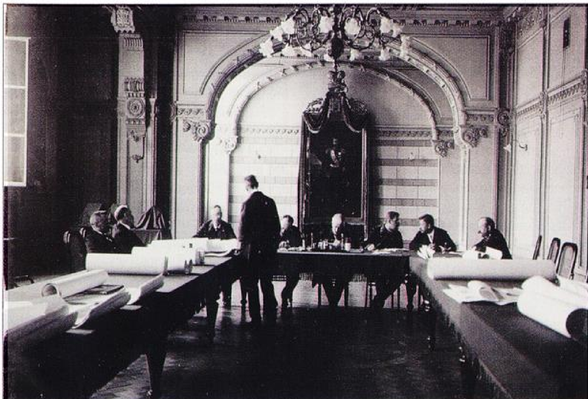
Заседание совета технологического института.

кальскую области. Общее число душевнобольных, которые одновременно лечились в этой больнице, достигало 1050 человек 10 . Побывав в одном из домиков, в котором жили больные, министры осмотрели фермы, образцовый питомник свиней, ткацкую мастерскую, зрительный зал, сцену и зал для отдыха больных, бильярдную, библиотеку. Гвоздём экскурсии стал только что образованный музей изделий больных и различных коллекций.