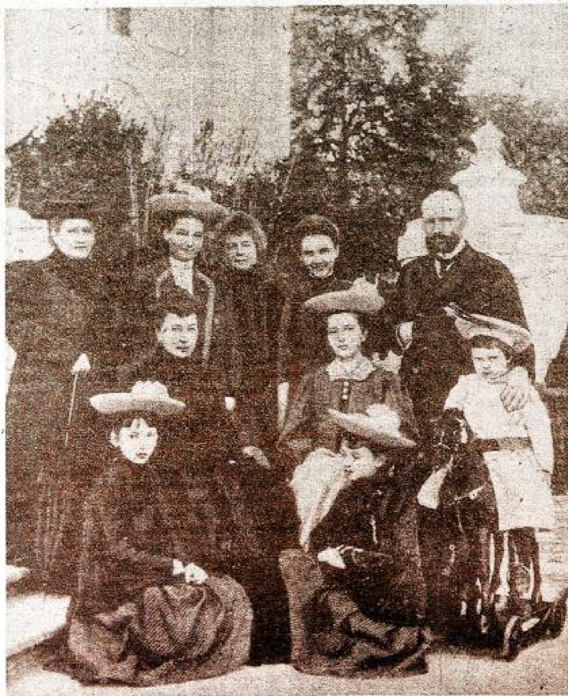
П. А. Столыпин с семьей.