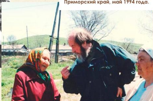
Обмен мнениями. Приморский край, май 1994 года.