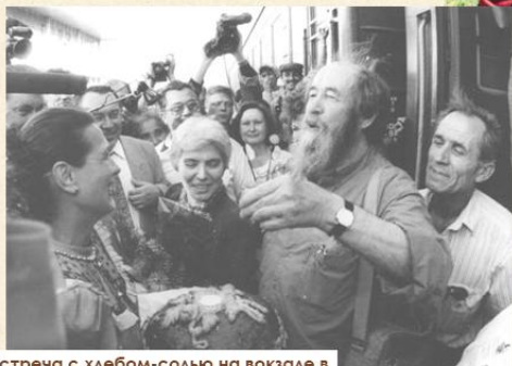
Встреча с хлебом-солью на вокзале в Хабаровске. Июнь 1994 года.