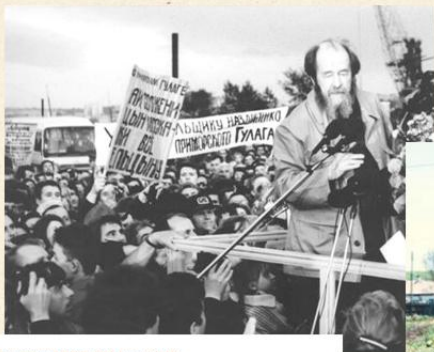
Возвращение на родину. Встреча во Владивостоке 27 мая 1994 года.