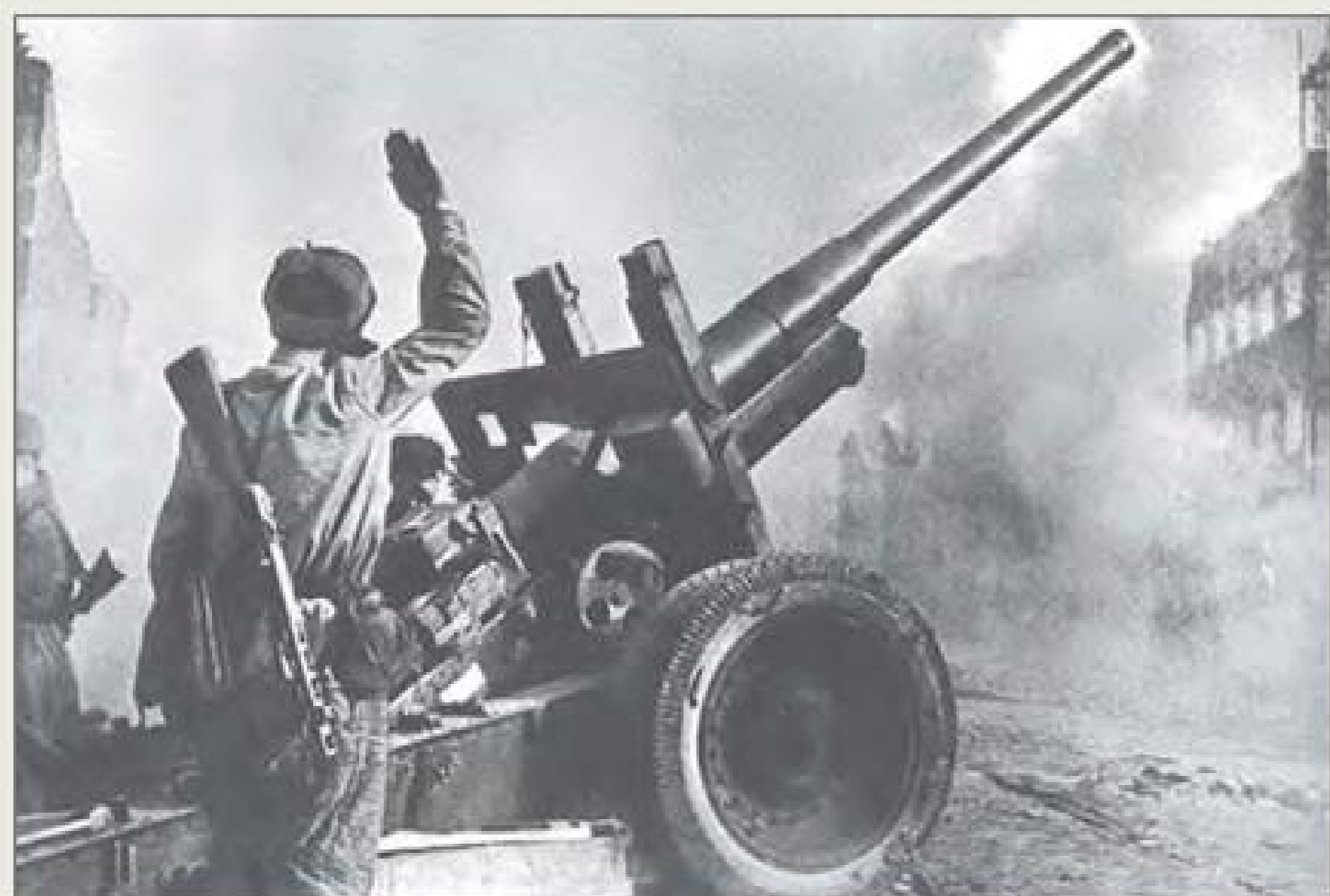
Советские артиллеристы ведут огонь из 122-мм гаубицы А-19 на улице Данцига ▲