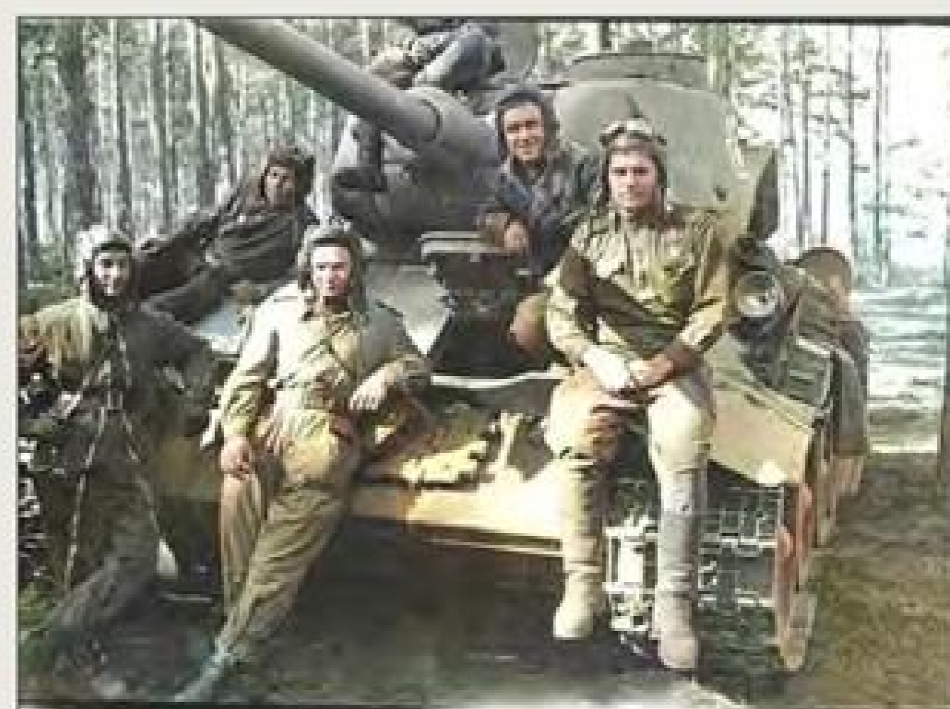
После боя Фото 28 февраля 1945 г. ▶