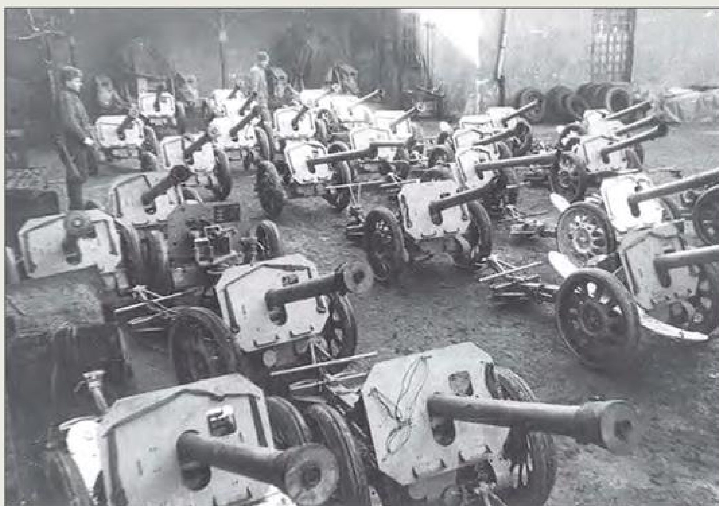
Немецкие станковые 88-мм противотанковые гранатомёты «Пупхен» (Raketenwerfer 43 «Puppchen»), захваченные советскими войсками в одном из городов Померании ▲