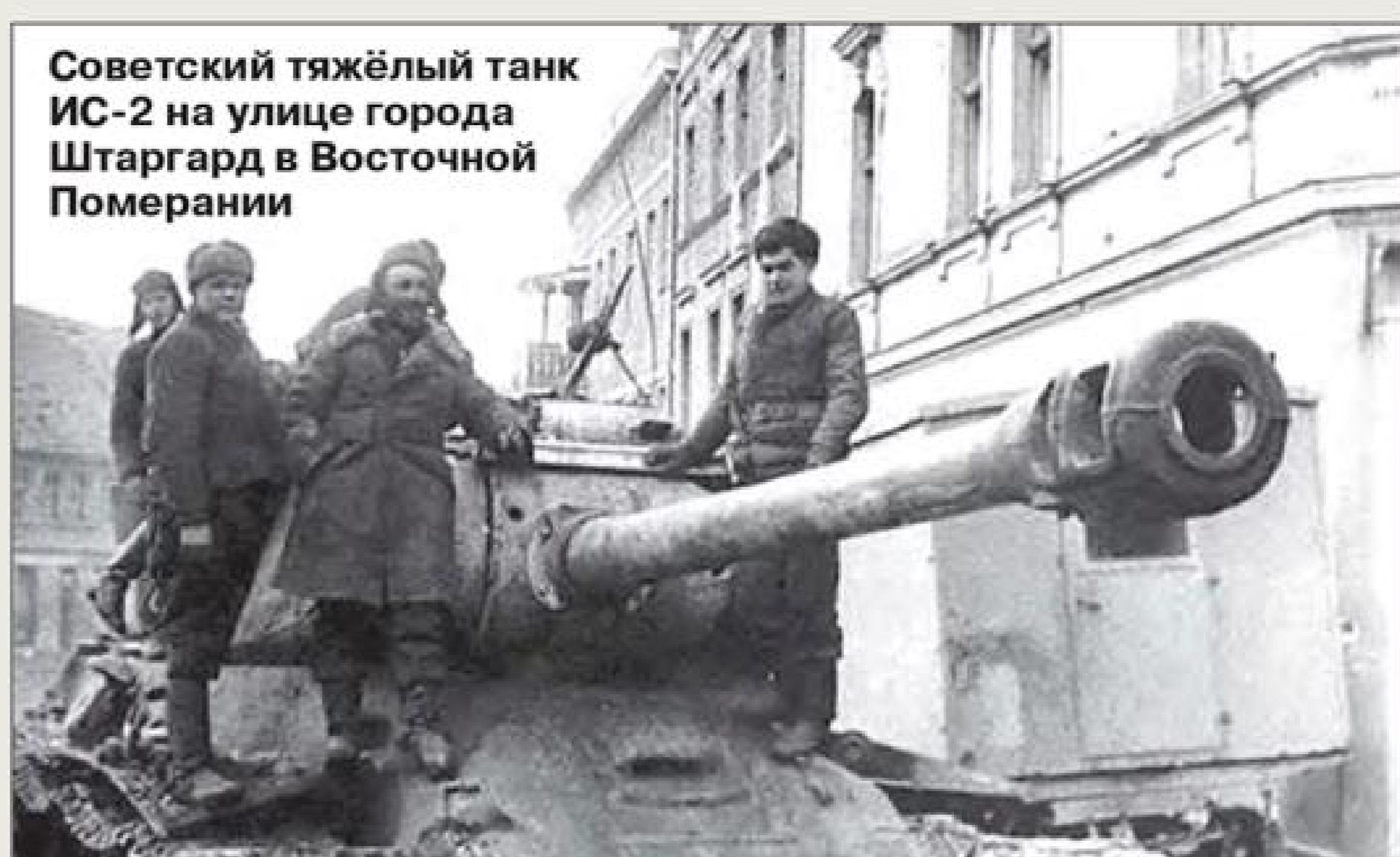
Советский тяжёлый танк ИС-2 на улице города Штаргард в Восточной Померании

От врага освободили всё южное побережье Балтийского моря — от Данцига (Гданьска) и Гдыни до устья Одера. Польскому народу вернули исконные славянские земли на побережье Балтийского моря, включая Померию-Поморье.