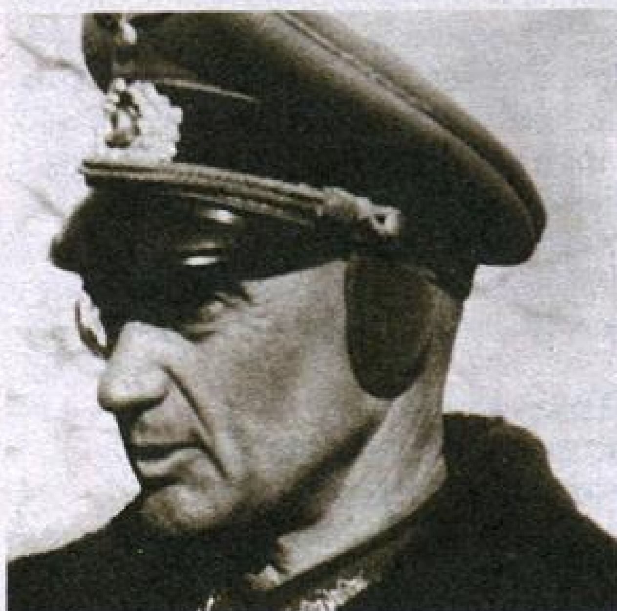
Вальтер Модель, сменивший в июле 1944 года Эрнеста Буша на посту командующего группой армий «Центр»

Ответ был очевиден. Самые мощные группировки вермахта и Красной армии были сконцентрированы на Украине и в Белоруссии. Но дальнейшее продвижение советских войск на юге не имело стратегической перспективы из-за нависшего над освобожденной Украиной так называемого «Белорусского балкона», который немцы могли использовать для нанесения стратегических контрударов.