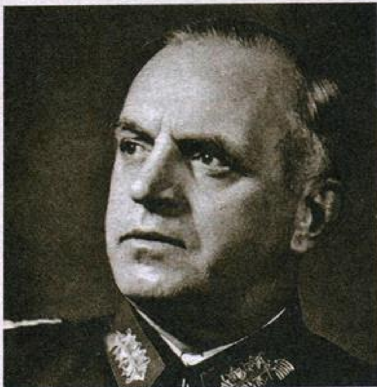
Командующий группой армий «Центр» Эрнест Буш