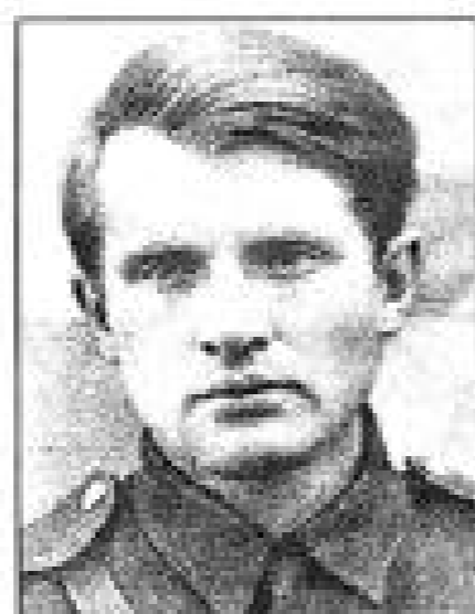
Сергей Наровчатов (1919–1981)