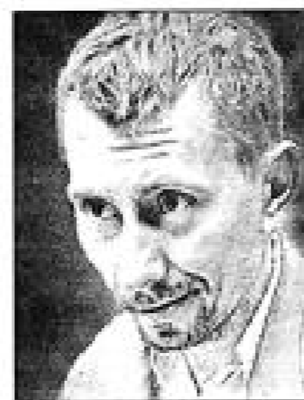
Николай Глазков (1919–1979)

Так и шли людские толпы. Что там толпы — тьмы! — Всех языков и наречий, всех земных племён. В эти дни земле свободу возвращали мы, В эти дни был сломлен нами новый Вавилон.