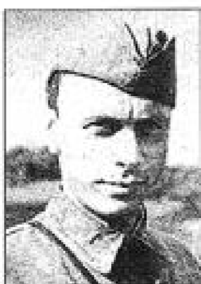
Леонид Вышеславский (1914–2002)