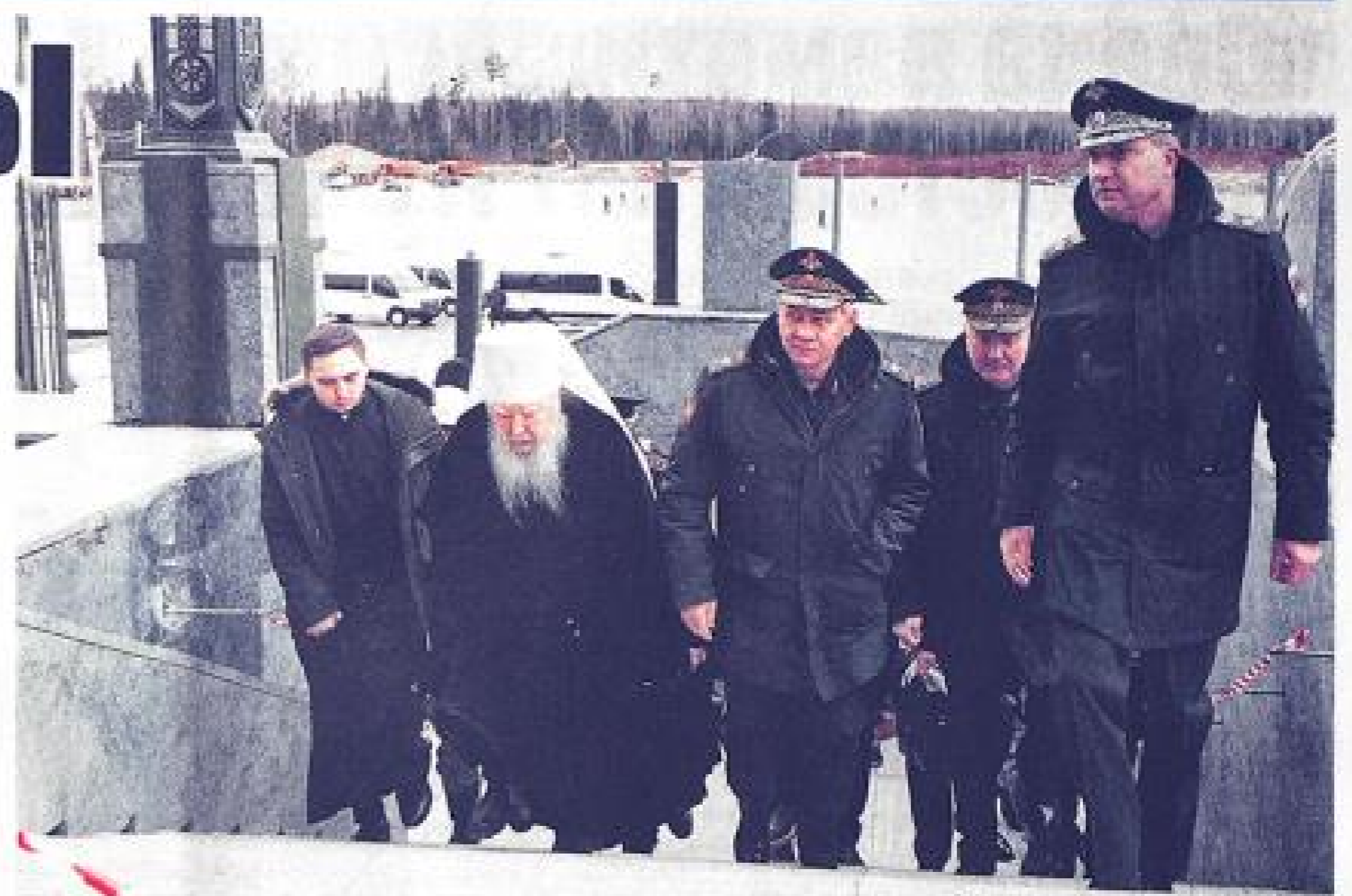
душой Главного храма Вооружённых Сил и всего российского воинства. На освящении образа Патриархом Московским и всея

развёртки поверхности изображения. После выбора одного из них с Василием Нестеренко было согласовано оптимальное соотношение фонового пространства, обрамляющего образ, к самому изображению Спасителя. Здесь особенно важно учитывать размещение образа именно в купольном пространстве. Если делать изображение меньше, то искажение минимально, если же