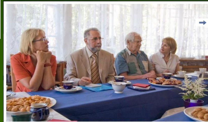
9-10 июля 2010 г. Обсуждение проекта «Электронная память Арктики» в Комарово Изображение 74 из 75