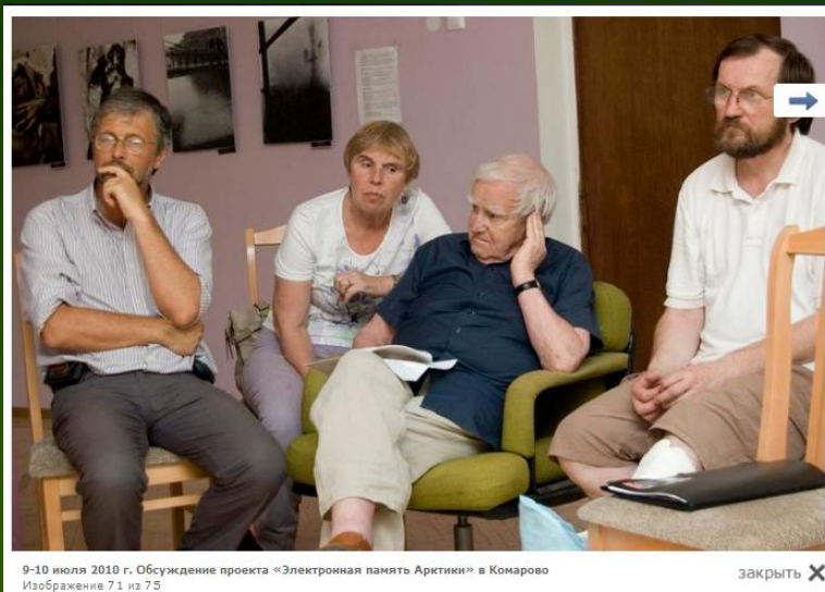
9-10 июля 2010 г. Обсуждение проекта «Электронная память Арктики» в Комарово Изображение 71 из 75