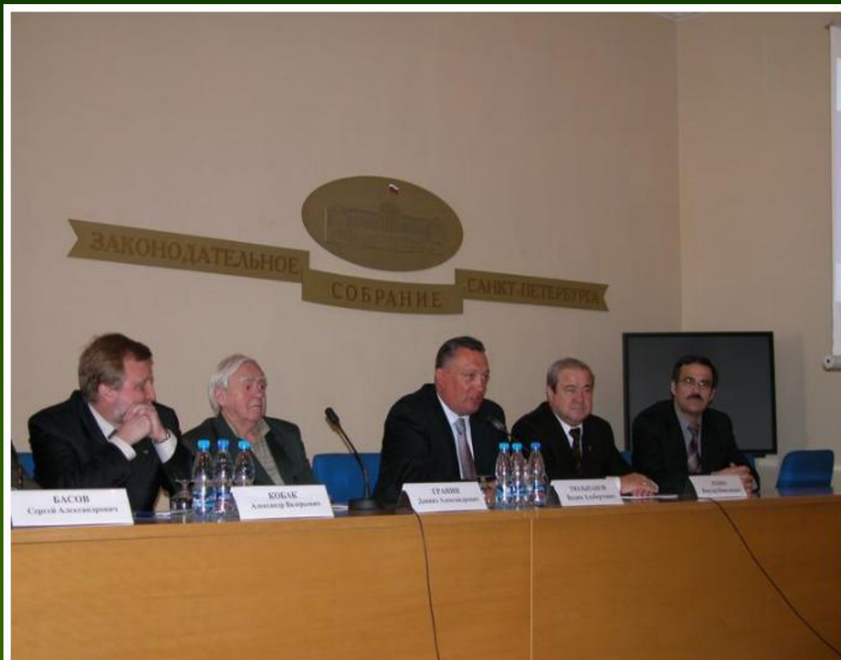
12 апреля 2005 Презентация интернет-портала «Энциклопедия Санкт-Петербурга» в Мариинском дворце. Изображение 20 из 75